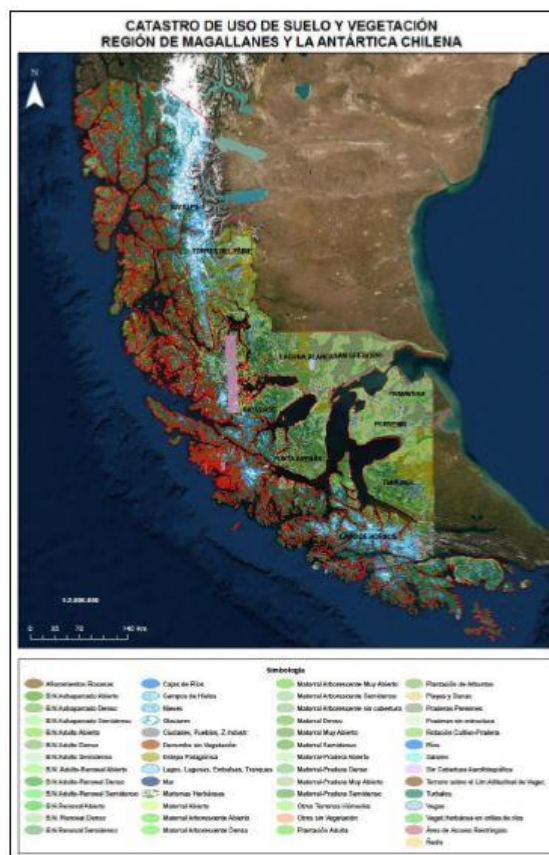
Catastro de Uso de Suelo y Vegetación, región de Magallanes y Antártica Chilena.

Se suma un ecosistema basado en bosques mixtos de lenga y coigüe de Magallanes. Aquí se mezclan especies siempreverdes y deciduas, coexistiendo con la lenga y el coigüe. Se desarrolla sobre las áreas más resguardadas del viento y con relativamente mejor drenaje. Forma el hábitat predilecto por especies de aves que hacen sus nidos en estos árboles, entre ellos el carpintero negro más grande de Sudamérica (Municipalidad de Cabo de Hornos, 2020).