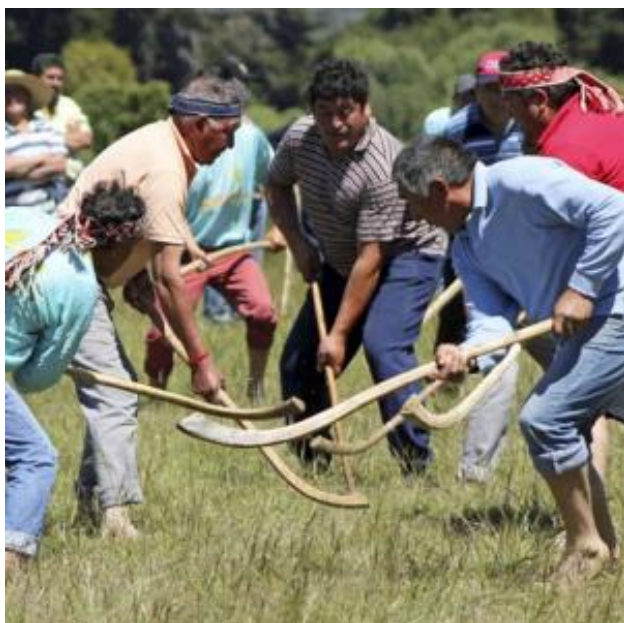
Encuentro de palín de Nahuelhuapi

Gran demostración del juego tradicional del pueblo mapuche: el Palín. Las comunidades aledañas al lago Budi se reúnen para compartir esta experiencia con los visitantes y dar a conocer el trasfondo ancestral de este rito. Además, el turista podrá degustar de ricas comidas del campo y de la gastronomía Mapuche, con música en vivo, venta de productos locales y puestos de artesanía para pasar el día en esta isla del borde costero (Servicio Nacional de Turismo, 2012).