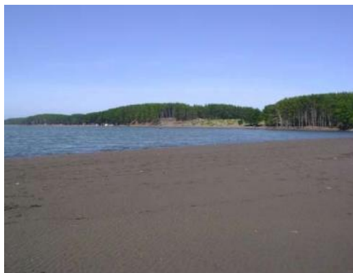
Balneario Los Pinos

Es el producto de un proyecto de recuperación de dunas ubicado frente a Puerto Saavedra. Es un lugar para la familia, con una hermosa zona de camping protegida de la brisa marina, además es ideal para niños por lo bajo de sus aguas, para el velerismo y juegos acuáticos, donde por efecto de las mareas, cambia el agua de la piscina natural, cada seis horas. El acceso a la playa se encuentra en buen estado, existiendo un camino habilitado al cual se puede llegar desde la Villa Maule (Servicio Nacional de Turismo, 2012).