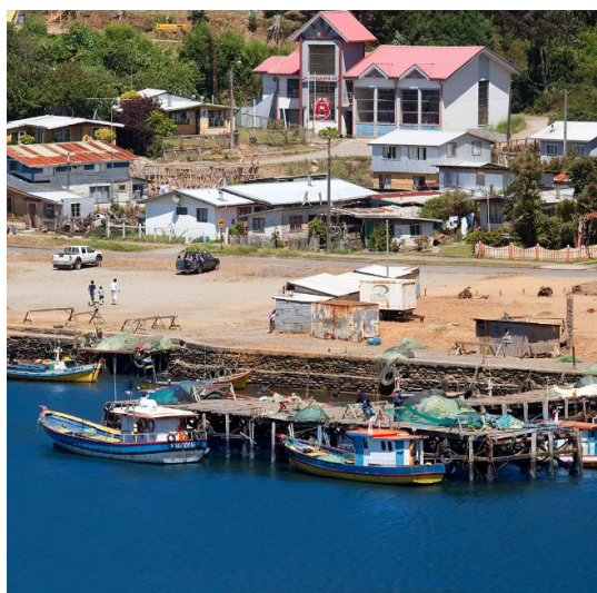
Caleta El Huilque

Se ubica al borde de la laguna Imperial, la cual es el principal desembarcadero de recursos pesqueros de Puerto Saavedra. En la caleta se puede disfrutar de pescados y mariscos frescos, además de la rica gastronomía de la zona, como también conocer sobre la cultura mapuche lafkenche y realizar entretenidos recorridos históricos con hermosos paisajes junto a pescadores de la zona que relatan las mejores anécdotas del mundo de la pesca y de la región de La Araucanía ( https://bit.ly/3ftk6DC ).