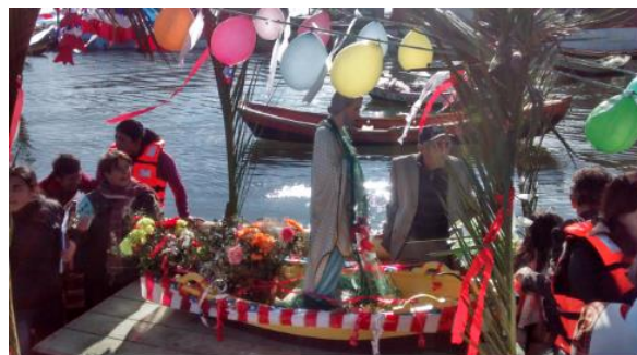
Fiesta de San Pedro

En el marco de la celebración de San Pedro y San Pablo, se organiza una misa y procesión, donde los pescadores engalanan sus botes y con la participación de la comunidad católica se realiza una navegación en el Río Imperial frente a su desembocadura ( https://bit.ly/3U4Ulsj ).