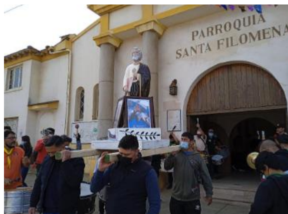
Fiesta de San Pedro

En el mes de junio los pescadores artesanales celebran a su patrono San Pedro con procesiones por tierra y mar. El 2022 la fiesta religiosa comenzó en la mañana con una procesión por las calles céntricas de la comuna y la participación de diferentes Bailes religiosos entre ellos de Coquimbo, Santiago, La Calera, Quillota, Boco, Concón, Horcón, Maitenes entre otros. participaron de esta celebración. Al mediodía se realizó una eucaristía en la Parroquia Santa Filomena. Por la tarde en la caleta de pescadores El Manzano y embarcadero, salen las embarcaciones con la imagen de San Pedro y la Virgen del Carmen, junto a una decena de lanchas y botes en la procesión por el mar. Una procesión llena de color y ritos ancestrales, donde los Bailes Chinos y Diabladas recorren el borde costero danzando al son de pitos y flautas ( https://bit.ly/3d7BkoR ).