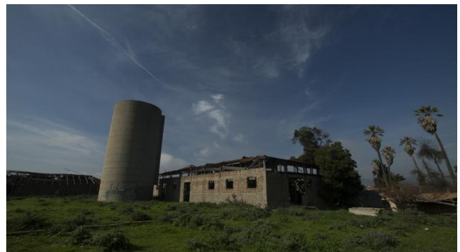
Casa y Bodega Ex Hacienda Santa Rosa de Colmo

Declarada Monumento Histórico D.S. 50 del 29/01/1987. La Hacienda Santa Rosa de Colmo tuvo su origen en la merced de tierra que el Gobernador Rodrigo de Quiroga otorgó en 1578 a Diego Hernández Corral. El entorno inmediato a la casa está constituido por la bodega y por algunas casas de administración. La primera data de mediados del siglo XVIII. El edificio sufrió algunas modificaciones a mediados del siglo XIX. El balcón volado que corría por tres fachadas sólo fue conservado en el lado sur. Al inmueble se le adosó un establo y granero, con lo cual se modificó su concepción arquitectónica de alquería (Servicio Nacional de Turismo).