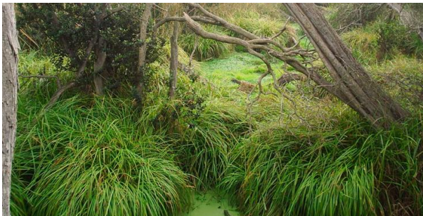
Las petras de Quintero

Declarado Santuario de la naturaleza D.S. 278 del 07/06/1993. Tiene una superficie de 42 hectáreas. Los principales atributos del área lo constituyen un bosque nativo de pantano del tipo relictual, siendo las especies predominantes la petra, el canelo y en menor grado de presencia el peumo, boldo y lun. Además, existe un sector de pajonal que rodea el bosque, asociado al mismo afloramiento de aguas que permite la existencia del bosque y las observaciones ornitológicas con unas 60 especies, entre las que figuran varias migratorias. Al este del pajonal y en un pequeño montículo se encuentra un conchal, donde es fácilmente detectable la presencia de restos de moluscos y bivalvos, junto a fragmentos cerámicos (Servicio Nacional de Turismo, 2012).