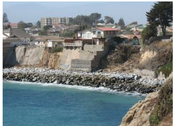
Playa El Papagayo

Está ubicada al lado oeste de Quintero. Es una playa larga y de fácil acceso, apta para tomar sol y bañarse (Servicio Nacional de Turismo, 2012).