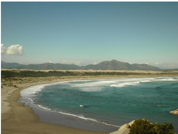
Playa de Ritoque

Es de las más grandes de la región de Valparaíso con una superficie aproximada de 18 km 2 ; al interior existen dunas de 5 a 8 kilómetros de extensión. Al comienzo de la playa está el Morro de Ritoque, donde hay un mirador, restaurantes, casas y un lugar para arrendar caballos, además de la ciudad Abierta de Ritoque, campo de experimentación arquitectónica de la Escuela de Valparaíso perteneciente a la Pontificia Universidad Católica de Valparaíso. Al norte de la playa hay bosque y campo antes de llegar a Quintero centro (Servicio Nacional de Turismo, 2012).