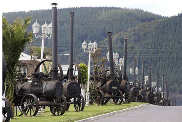
Colección 32 locomóviles de Carahue

La muestra comprende un número considerable de piezas con tipología, fabricación y lugar de procedencia. Se encuentra conformada como un museo al aire libre característico de la comuna de Carahue, lo que da un carácter adicional a su valor patrimonial e histórico como protagonistas del desarrollo nacional, alzándose, así como un elemento identitario propio de la comuna y de la región (Consejo de Monumentos Nacionales, 2022).