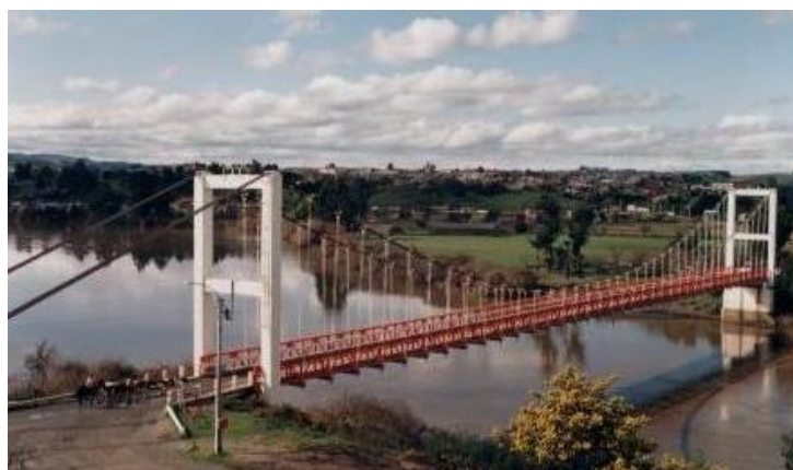
Puente presidente Eduardo Frei Montalva

Es un puente colgante sobre el río Imperial que se comenzó a construir en el año 1946 y se inauguró en 1949. En el año 2000 y con la presencia del entonces presidente de Chile Eduardo Frei Ruiz-Tagle, se bautizó al viaducto como “Puente presidente Eduardo Frei Montalva”, inaugurándose además otras cuatro estatuas de grandes leones, los cuales están ubicados en ambos extremos del puente. Estas estatuas, que son las mayores piezas de cobre fundido en el mundo, representan las cuatro virtudes cardinales: fortaleza, justicia, prudencia y templanza (Servicio Nacional de Turismo).