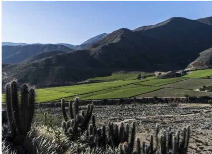
Figura N° 11 Rapel, Monte Patria