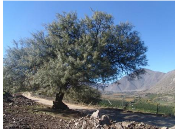
Figura N° 1 Algarrobo de Rapel

Gracias a la lucha que dieron los habitantes del valle del río Rapel, este Algarrobo pudo ser salvado de que la empresa que estuvo a cargo de la pavimentación de la ruta D-557 lo cortara, ya que en primera instancia el camino pasaría por donde aún sigue este emblemático árbol.