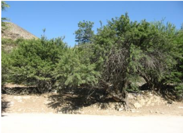
Figura N° 2 Bosque de Algarrobo