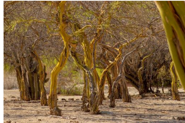
Figura N° 3 Bosque de Chañar

Un verdadero descubrimiento de la naturaleza es el bosque de la quebrada del Macano en Tulahuén, situado a un costado del camino a Las Ramadas, de fácil acceso y debidamente señalado. Es un bosque nativo en buen estado de conservación donde se puede realizar senderismo y contemplación, disfrutando de un entorno natural casi virgen, ideal para fotografía ( Turismo Región de Coquimbo ).