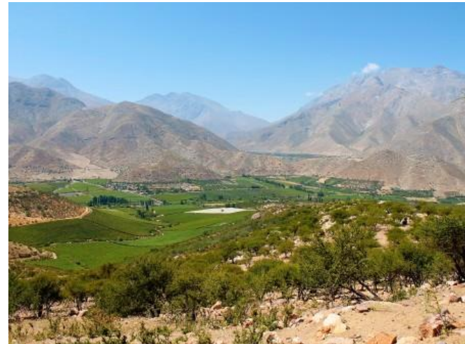
Figura N° 15 Valle Río Mostazal

Es uno de los valles menos intervenidos por lo que basa principalmente su economía en la agricultura de subsistencia y en la ganadería caprina. Entre las potencialidades turísticas destacan la arquitectura tradicional y el arte rupestre prehispánico ( Municipalidad de Monte Patria ).