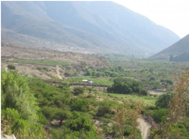
Figura N° 16 Valle Río Ponio

En cuanto al potencial turístico del territorio destaca el paisaje natural donde se pueden desarrollar actividades de ecoturismo y la gran cantidad de sitios arqueológicos de arte rupestre prehispánico ( Municipalidad de Monte Patria ).