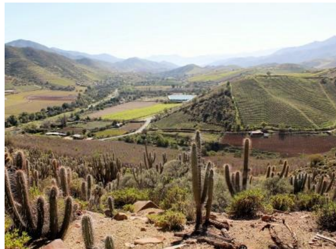
Figura N° 14 Valle Río Huatulame

la ribera del río, además de actividades de pesca ( Municipalidad de Monte Patria ).