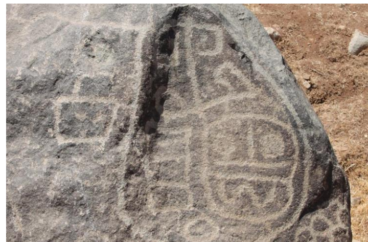
Figura N° 10 Petroglifos, Monte Patria

Los petroglifos se encuentran diseminados por todos los ríos y valles de la comuna, pudiéndose apreciar en Huatulame a un costado de la carretera, en Chañaral Alto, en la quebrada de Nomuco, en valle del río Ponio cercano a Campanario, en el sector El Cuyano, Tulahuén, El Palqui en el cerro El Buitre, entre otros. Este último, tiene la característica de ser un cerro santuario ( Turismo Región de Coquimbo ).