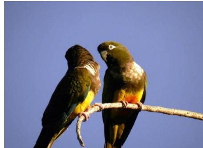
Figura N° 17 Loros Tricahue

ríos y humedales altoandinos en una topografía con alturas que van desde los 400 a los 4000 [msnm] en la alta cordillera, convirtiendo a la zona en escenario ideal para el avistamiento de aves nativas como el cóndor, el águila, el tucúquere, el pitio, el pato cortacorriente, el huala y aves endémicas como la turca, la tenca, la perdiz chilena y el emblemático loro Tricahue que se posa durante el atardecer en el centro de Monte Patria. El embalse La Paloma, interior del Valle Río Ponio, El Maitén en valle Mostazal, Las Ramadas en Río Grande y las Mollacas en Valle Rapel, son puntos de interés para el avistamiento de aves ( Turismo Región de Coquimbo ).