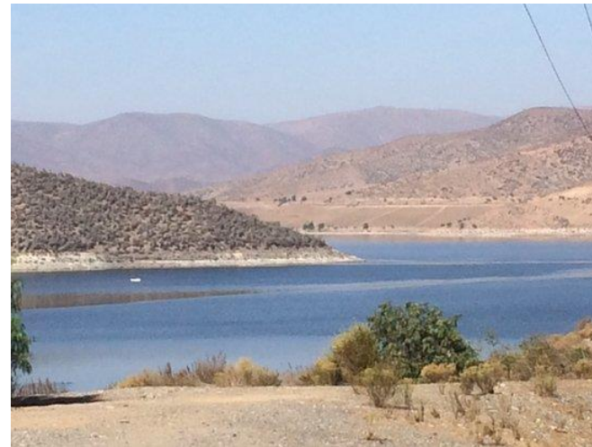
Figura N° 6 Embalse La Paloma

Posee una capacidad de 750 millones de metros cúbicos y cubre una superficie de 3.000 hectáreas. El embalse fue construido entre los años 1959 y 1966, siendo inaugurado en el año 1968. Almacena las aguas del río Grande y Huatulame. Es el embalse de riego más grande de Chile y el segundo más grande de Sudamérica. En él se puede realizar diversos deportes náuticos, tales como windsurf o kitesurf, además de pesca deportiva (Servicio Nacional de Turismo, 2012).