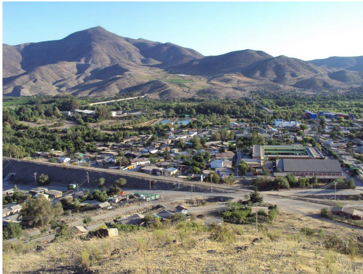
Figura N° 8 Monte Patria