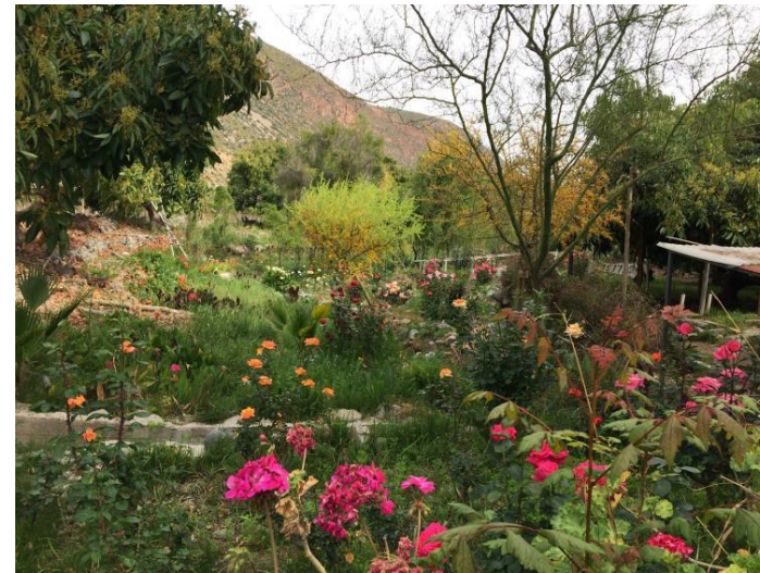
Figura N° 9 Parque Ecológico La Gallardina

parque. Sybilla, su dueña ha ideado un parque que está lleno de sorpresas y que cuenta con zonas de asado, visitas a los viñedos colindantes, habitaciones equipadas, piscina y un completo sistema de alimentación (Servicio Nacional de Turismo, 2012).