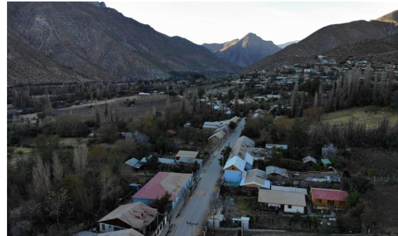
Figura N° 12 Tulahuén, Monte Patria

Pueblo típico y apacible con arquitectura en piedra y adobe. Existe una extensa cultura local, producción caprina (charqui y queso) y vino dulce. Lleno de tradiciones, destacan sus artesanos los cuales desarrollan una amplia gama de actividades, entre estas se recomienda visitar el taller de artesanos de lapislázuli y la cooperativa de vinos Secretos del Valle. Además, destacan sus típicas construcciones en una o dos plantas, las que en su mayoría se encuentran teñidas con pinturas hechas con tierra de colores (Servicio Nacional de Turismo, 2012).