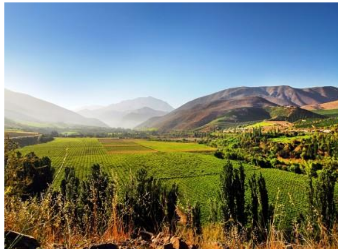
Figura N° 13 Valle Río Grande

Según datos del año 2006 la base productiva del sector de río Grande Alto se basa principalmente una agricultura familiar basada en ganadería caprina y de huertos. Por otra parte, en el sector también se encuentran predios con cultivos de uva pisquera y la planta de la pisquera Tulahuén, dedicada a la producción de pisco premium ( Municipalidad de Monte Patria ).