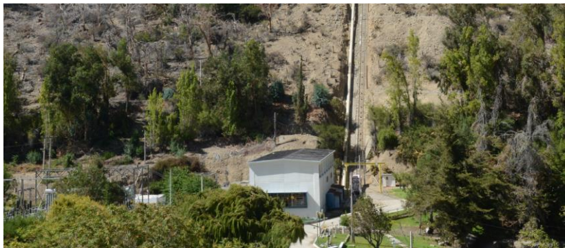
Figura N° 4 Central Los Molles

La central hidroeléctrica Los Molles, con una potencia de 16.000 kw y sus respectivas líneas de transmisión, entraron en servicio en diciembre de 1952 (Servicio Nacional de Turismo, 2012), abarcando las principales ciudades de la región de Coquimbo.