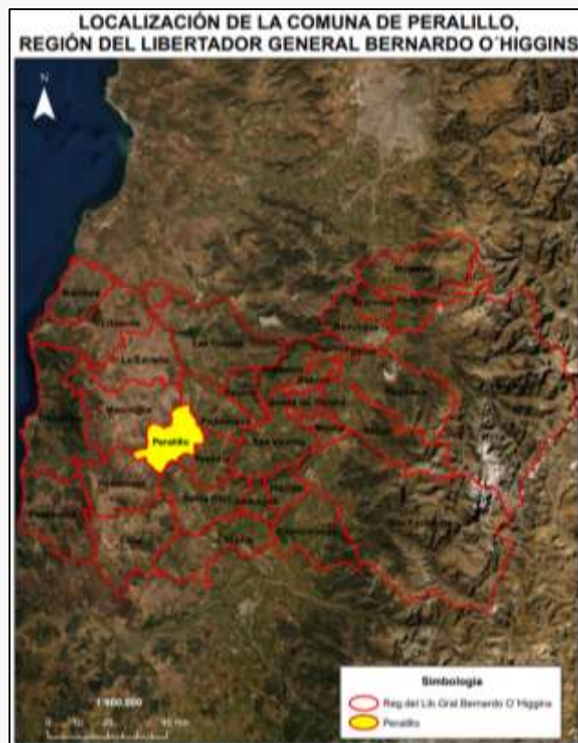
Límite comunal Peralillo

El 25 de noviembre de 1902, por Decreto Supremo, se creó la comuna de Peralillo, con asiento en el pueblo de igual nombre, asumiendo como primera autoridad comunal Carlos Errázuriz Mena, de tendencia conservadora (Municipalidad de Peralillo, 2015).