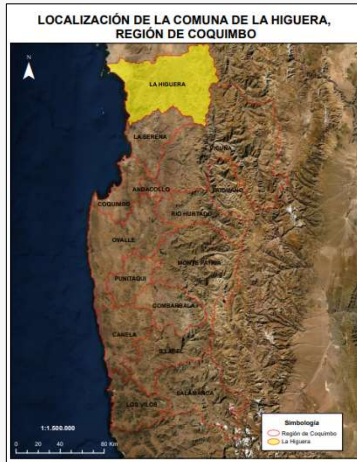
Límite comunal La Higuera

Luego su riqueza se va agotando por lo que el puerto de Totalillo va lentamente muriendo. Sin embargo, surge el mineral de hierro, que con su principal yacimiento en cerro El Tofo da nacimiento a un puerto de embarque, Cruz Grande, hasta donde ira a recorrer el primer tren eléctrico minero instalado en América (Municipalidad de La Higuera).