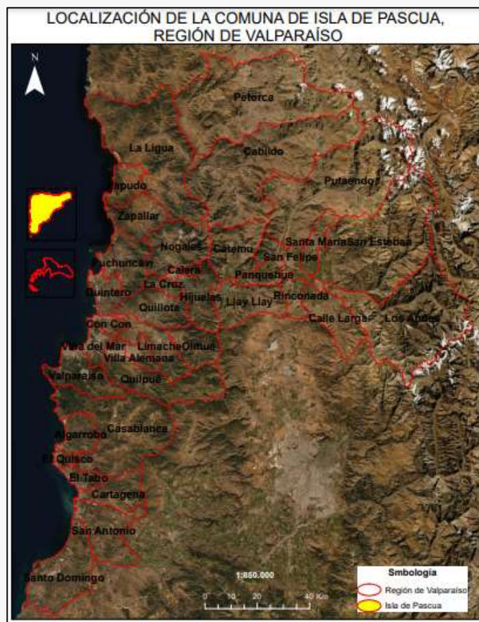
Límite comunal Isla de Pascua

Como Isla de Pascua la bautizó el navegante neerlandés Jacob Roggeveen, que la descubrió el 5 de abril de 1722, ya que la fecha correspondía al día de Pascua de Resurrección. Su nombre fue Paasers en neerlandés, luego traducido a Pascua ( https://bit.ly/3na7O4B ).