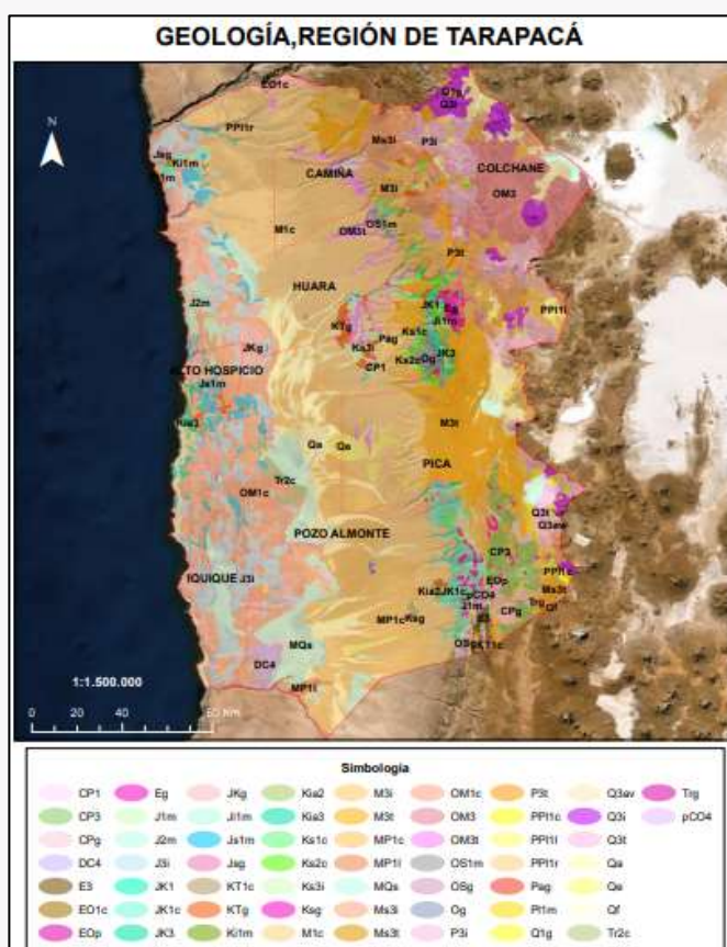
Mapa Geológico de Chile, región de Tarapacá

En el contexto geológico comunal, la cordillera de la Costa, formación que corresponde a un solevantamiento del Terciario, está constituida por rocas antiguas (afloraciones de rocas grano-dioríticas; del Jurásico y Cretácico, como las margas, lutitas y calizas), sobre las cuales se han depositado sedimentos recientes, trasladados por la acción eólica y principalmente de las avenidas estacionales. Por otro lado, la depresión intermedia está constituida por secuencias superpuestas de relleno sedimentario, llegando a encontrarse por lo menos 5 capas aluviales, de gravas y bloques, siendo los rellenos recientes de detritos más fino, en concomitancia con materiales volcánicos, como las cineritas y material hidrovolcánico (Municipalidad de Huará, 2016).