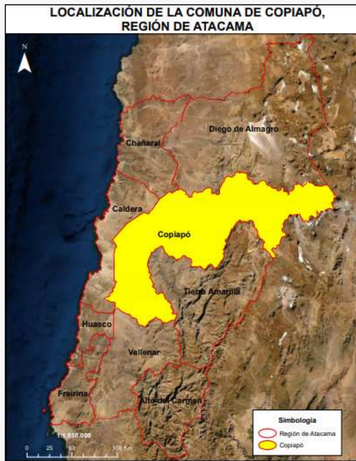
Límite comunal Copiapó

La comuna fue fundada el 8 de diciembre de 1744 como San Francisco de la Selva de Copiapó, aunque su origen se remonta antes de la llegada de los españoles, cuando formaba parte del imperio inca. En ese entonces los indígenas llamaban a este territorio Copayapu ("Copa de oro", o "valle verde") ( https://bit.ly/3thAKst ).