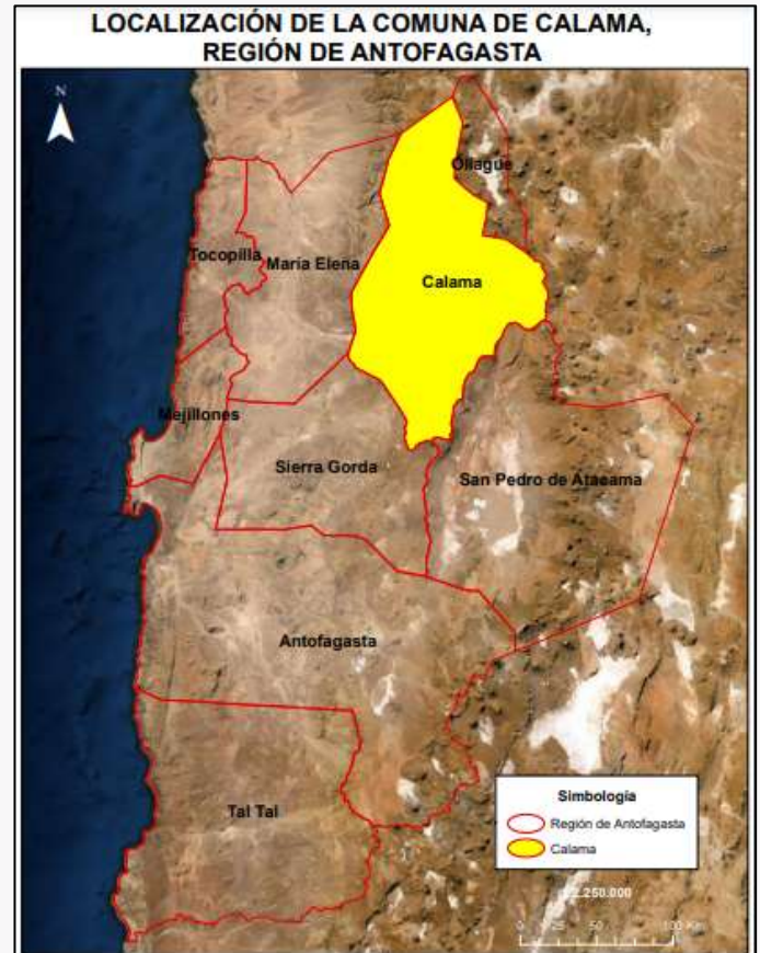
Límite comunal Calama

Desde la conquista chilena de Calama, pasó casi una década de abandono por parte del sistema político y económico chileno. Recién el 13 de octubre de 1888, bajo el gobierno de José Manuel Balmaceda Fernández, es creada la Ilustre municipalidad de Calama, siendo su primer alcalde don José Lira. El edificio consistorial, fue levantado ese mismo año ( https://bit.ly/3tefmnF ).