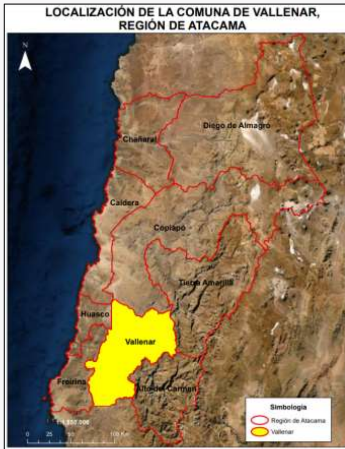
Límite comunal Vallenar

El desarrollo histórico de Vallenar depende mucho de la minería: las minas de plata, cobre y hierro en sus alrededores formaron considerablemente la ciudad. En 1892 llegó el ferrocarril desde Huasco, más tarde se conectó con la red del Norte (1913). Los baños a vapor abrieron en 1903, la línea telefónica Huasco - San Félix se concretó en 1909, y la compra del reloj de la torre de la iglesia en Munich (Alemania) en 1910 mostraron el fuerte crecimiento de esa época (SUBDERE).