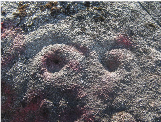
Petroglifos Cerro La Costilla

La población de San Juan Bautista de NEGRETE fue considerada como capital de la jurisdicción o comarca de la localidad de Puchacay, la cual en el año 1786 se transformó en el Partido de la ciudad de Puchacay, subalterno de la administración de la provincia de la Concepción hasta el año 1799, hasta que el partido fue modificado por la Villa de San Antonio de la Florida ( https://www.lugaresturisticos.org/NEGRETE/#San Juan Bautista ).