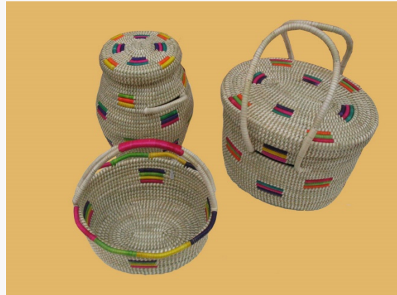
Cestería de NEGRETE

La cestería de NEGRETE tiene origen indígena y destaca por la complejidad y belleza de su trama, el material es el chupón y coirón, con el cual van formando un cordón firme, apretado y largo. El coirón es el alma del tejido y el chupón, se embarrila en torno a éste. Los objetos más famosos que se producen son costureros, paneras e individuales (Servicio Nacional de Turismo, 2012).