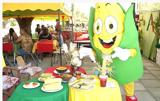
Fiesta del Choclo

En período estival, en el mes de enero se realiza esta tradicional fiesta, en donde se realizan diferentes preparaciones en torno al choclo, rescatando tradiciones, generando exposiciones de comida típica y artesanía ( https://muniNEGRETE.cl/web/2019/02/04/fiesta-del-choclo-de-NEGRETE-sigue-siendo-la-mejor-de-la-region/ ).