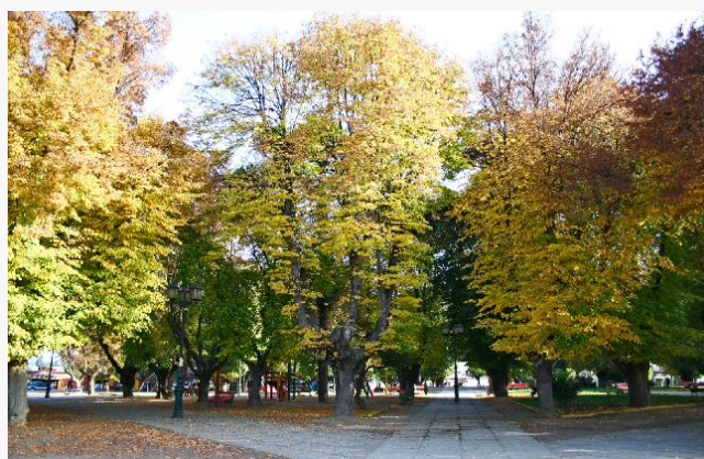
Plaza de NEGRETE

Se encuentra en el centro de la ciudad, y posee amplios y extensos senderos, una flora boscosa que ofrece una frescura única con espaciosos árboles y pájaros, ofreciendo un ambiente completamente tranquilo ( https://www.lugaresturisticos.org/NEGRETE/ ).