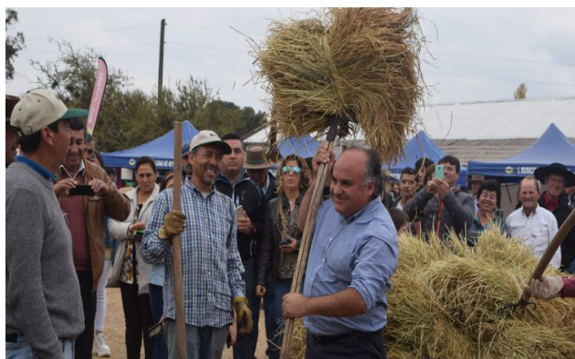
Fiesta de la Trilla del Arroz

La Fiesta de la Trilla del Arroz presenta también un espacio gastronómico, en que los asistentes podrán degustar diferentes preparaciones elaboradas en base al arroz proveniente de la trilla.