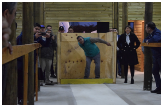
Lanzamiento de tejo, en cancha de rayuela

Retiro cuenta con sede y cancha para el deporte de la rayuela, el cual se posiciona como único en la zona, permitiendo con ello la promoción y cuidado de tradiciones que se encuentran presentes en la idiosincrasia chilena.