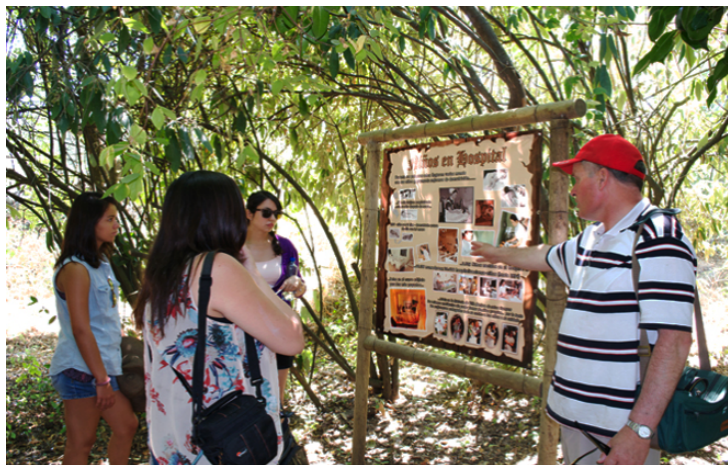
Tour colonial, Villa Baviera

Entre las actividades que se destacan, están tour colonial, piscina, trekking, bicicletas, hidrobikes, juegos infantiles y un museo del recuerdo.