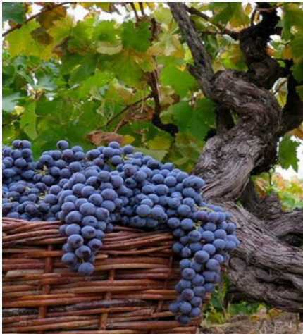
Enoturismo en el Valle del Maule

Entre los viñedos que se pueden encontrar figuran la Viña González Bastías, Vía Wines, Gillmore State, Balduzzi y Casa Donoso.