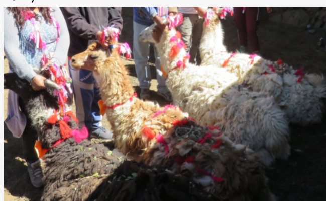
Enfloramiento de llamos

Se realiza el heroseamiento de estos animales domésticos. Es una costumbre de carácter ritual, ancestral, de los pueblos originarios indígenas que habitan los sectores alto andinos de América del Sur (Servicio Nacional de Turismo, 2012).