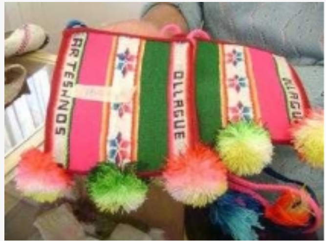
Artesanía de Ollagüe

Esta agrupación se constituye desde el año 2001 como un grupo emergente de tejedoras en fibras naturales de llama, alpaca y oveja. Esta agrupación es de gran importancia para el desarrollo de las actividades productivas en la comuna, ya que dinamiza tanto el sector de los tejidos, así como también el de los micro ganaderos de la comuna al poder convertirse en proveedores de lana (Municipalidad de Ollagüe, 2008).