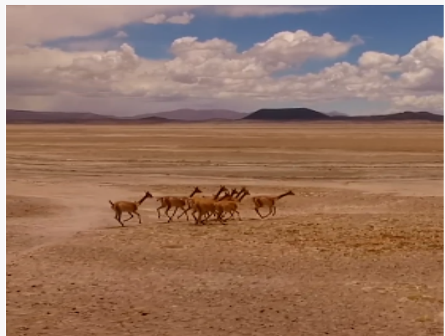
Salar de Carcote

Forma parte del macrotramo Ollagüe del Sendero de Chile, ubicándose 5 miradores en sus bordes; Lunita, Laguna El león 1 y 2, Carcote y Laguna Verde (Servicio Nacional de Turismo, 2012).