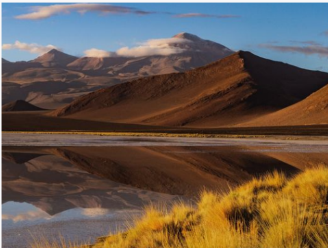
Salar de Ascotán

Es un salar de tipo “playa” con limos salinos y costras de sales (yeso, halita). A unos decímetros debajo de la superficie, se encuentra una napa de salmuera. Lagunas más pequeñas y menos numerosas se pueden observar cerca de la orilla oeste del salar. Está a ubicado a una altura de 3.716 msnm, a 76 kilómetros al sur de Ollagüe (Servicio Nacional de Turismo, 2012).