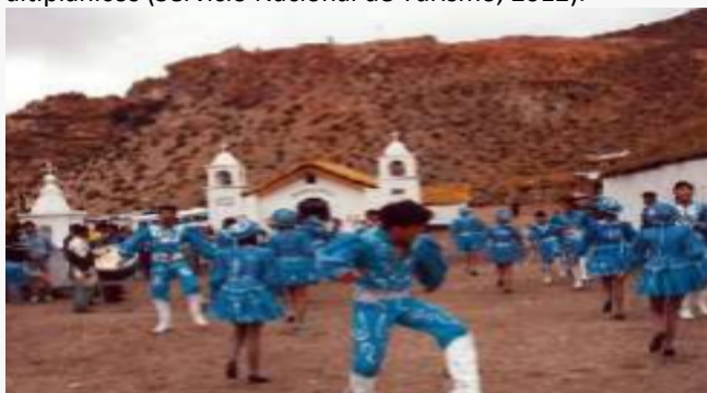
Bahía de corral

El pueblo celebra la fiesta religiosa más importante de "Nuestra Señora del Rosario de Andacollo de Coska", la cual comienza cada 25 de diciembre y concita una asistencia de jerarquía internacional, con peregrinos venidos de países altiplánicos (Servicio Nacional de Turismo, 2012).