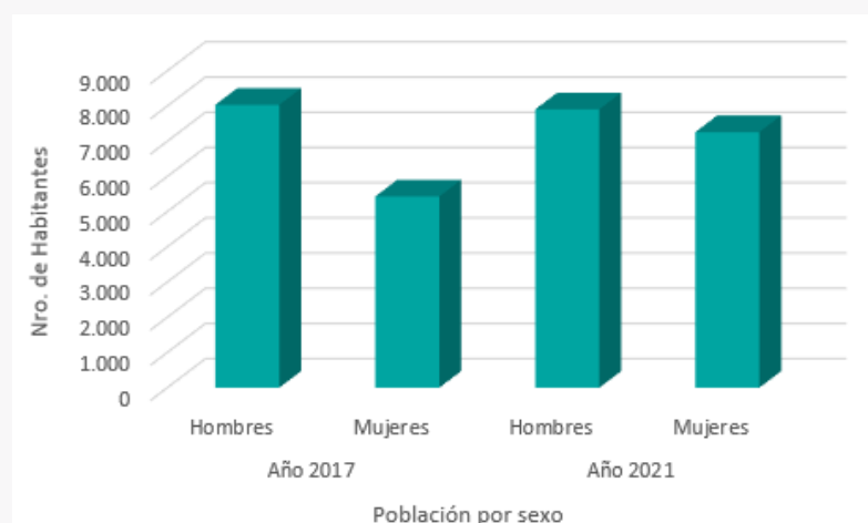
Población por sexo 2017 y proyección 2021, Comuna de Mejillones.