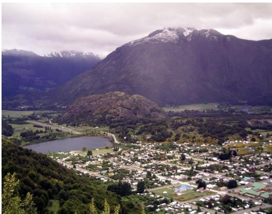
Cerro La Bandera

Desde todo el pueblo es posible admirar el cerro La Bandera, en cuya cima, permanece flameando el pabellón nacional, el que es mantenido por Carabineros y por el grupo scout. Un pequeño sendero conduce a la cima en pocos minutos para disfrutar de una vista maravillosa del valle. (SERNATUR, 2012).