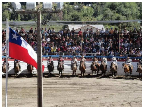
Rodeo oficial de Futaleufú

El Club de Rodeo de Futaleufú fue creado en el año 1960 por el interés de los antiguos pobladores de la comuna, para preservar las tradiciones chilenas. El rodeo oficial se lleva a cabo una vez al año con la finalización de la semana de Futaleufú, además durante el año se efectúan diferentes actividades como doma de caballos y novillos (SERNATUR, 2012).