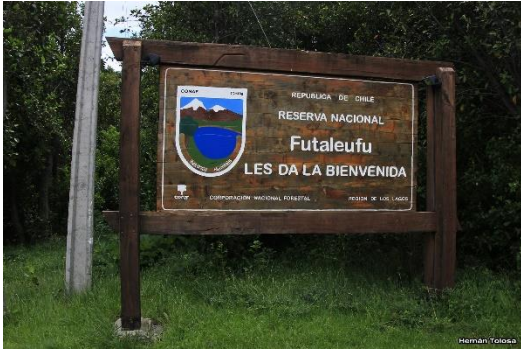
Reserva Nacional de Futaleufú

Con 12.065 hectáreas de siempreverdes, la Reserva Nacional Futaleufú cuenta con una vegetación virgen y con una fauna extraordinaria, dentro de la cual podemos encontrar al huemul, especie protegida por la Corporación Nacional Forestal (CONAF). Se pueden realizar cabalgatas, contemplación de la flora y fauna, fotografía (SERNATUR, 2012).