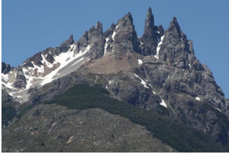
Cerro Tres Monjas