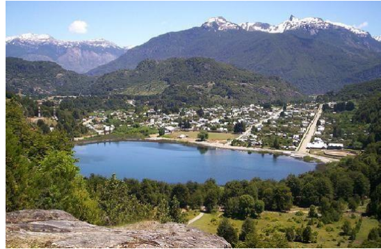
Mirador Torre de Agua

Bordeando la laguna Espejo, se entra por un terreno a mano derecha donde se alcanza a ver una escalera que sube un cerro. Se sigue por la escalera, bastante larga y se llega arriba a un hermoso mirador de la laguna Espejo, dejando al pueblo y las montañas atrás. En la cima también se encuentra un boulder de piedra para los que les gusta escalar ( https://bit.ly/3wdw5sR ).