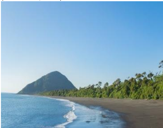
Playa Santa Bárbara

Es una hermosa playa que permite la práctica de deportes náuticos, posee arena fina y agua transparente. Desde allí se observa el volcán Corcovado y el macizo del morro Vilcún (SERNATUR, 2012).