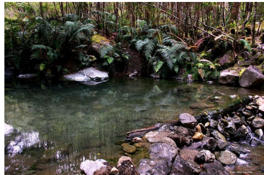
Termas de Porcelana

Las termas de Porcelana están ubicadas al fondo del fiordo Comau en la ladera oeste. Su acceso es sólo posible por vía marítima. Pozones a orillas del río Porcelana con aguas a temperaturas de 60 °C. Geiser Porcelana, duración excursión entre tres y tres horas y medias (dificultad media). Las Termas de Porcelana no posee servicios sólo espacio para acampar (SERNATUR, 2012).