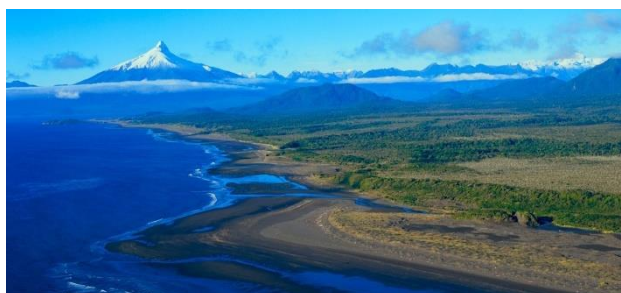
Parque Nacional Corcovado

Su superficie abarca las 293.986 hectáreas. Gran parte del territorio se ubica en la comuna de Chaitén. Uno de sus principales objetivos de creación es el de proteger los ecosistemas únicos que alberga en su interior, como bahías, fiordos, ríos, volcanes, valles y montañas, entre otros. Grandes zonas de su terreno, ubicado en la región de Los Lagos, fueron modeladas por la glaciación y forman paisajes únicos y de gran belleza escénica. Este lugar está catalogado como uno de los últimos sitios puros del planeta. Gran parte del área del parque está cubierta por bosques, principalmente de tipo siempreverde, lenga, coigüe de Magallanes y ciprés de las Guaitecas (SERNATUR, 2012).