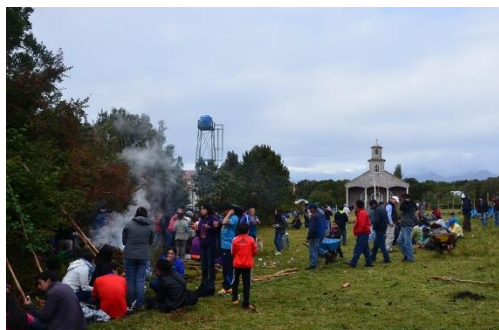
Fiesta Costumbrista Camino Costero de Chaitén

La primera vez que se llevó a cabo esta fiesta costumbrista fue en febrero de 2015. Este evento fue organizado por las juntas de vecinos de las localidades de Chumelden, San Ignacio de Loyola y Casa de Pesca con el apoyo de la Ilustre Municipalidad de Chaitén. El objetivo principal de esta conmemoración es el rescate de las tradiciones del sector y sus antepasados, y a su vez persigue apoyar la conectividad entre los sectores costeros con Chaitén (El Huemul).