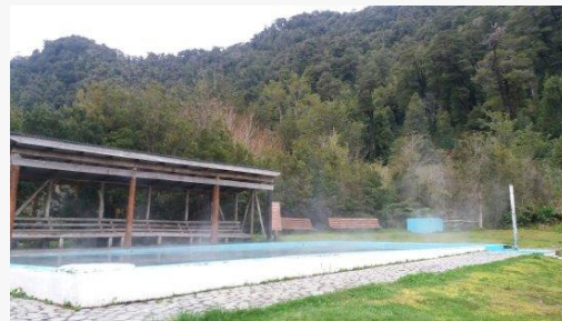
Termas El Amarillo

Es la entrada sur al Parque Pumalín. Sus aguas provienen de las afloraciones del volcán Michinmahuida y alcanzan temperaturas promedio de 52 °C. Estas aguas, calientes y relajantes, pueden ser disfrutadas no sólo a través de los tradicionales baños, sino que también den aquellos con barro y vapor. Se realizan también masajes terapéuticos. En el camping El Amarillo se ubican dos amplias piscinas termales techadas, dos piscinas termales exteriores a distintas temperaturas, pabellón de pozos individuales, sala para baños de barro, sala de masajes termales (en el agua), cabañas y un restaurante (SERNATUR, 2012).