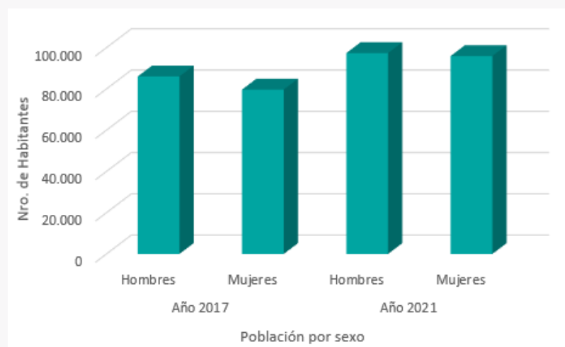
Población por sexo 2017 y proyección 2021, Comuna de Calama.