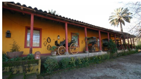
Casona Hacienda de Alhué