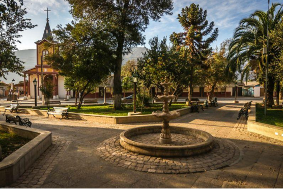
Plaza de Armas de Alhué

Lugar bastante concurrido por los habitantes de la zona. En ella se ofrece todo tipo de trabajos como talabartería, mermeladas chilenas artesanales, tejidos, aguardientes de uvas y la clásica mistela ( https://bit.ly/3nALekj ).