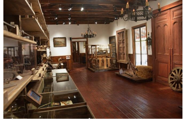
Museo de Alhué

Su fachada corresponde a la Casa Parroquial y brinda a todos los turistas, una visita por tres salas que exhiben objetos religiosos (como cáliz, patenas, armonio), indumentaria sacerdotal, libros parroquiales, pinturas religiosas, cantidades de piezas antiguas (como ruedas de carreta, herramientas agrícolas) y un gran salón audiovisual, donde se exponen fotografías antiguas del pueblo y sus habitantes, y videos de archivo con reportajes a la gente del lugar ( https://bit.ly/3nALekj ).