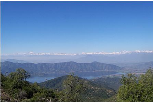
Reserva Natural Altos de Cantillana

La reserva fue creada el año 2008, como iniciativa de la Corporación Altos de Cantillana, la que agrupa a cuatro grandes propietarios del Cordón Altos de Cantillana. Dicha reserva incluye los terrenos sobre la cota 1.000 de los fundos La Huachera de Aculeo, Los Hornos de Aculeo, Fundo Rangue y Fundo La Rinconada de Chocalán, identificados como la zona de mayor valor ecológico en el marco del proyecto para la Conservación de la Biodiversidad de Altos de Cantillana. La reserva constituye un reservorio único a nivel regional, nacional e inclusive mundial, de vida silvestre, siendo posible observar además de flora y fauna característica, una serie de procesos ecológicos (SERNATUR, 2012).