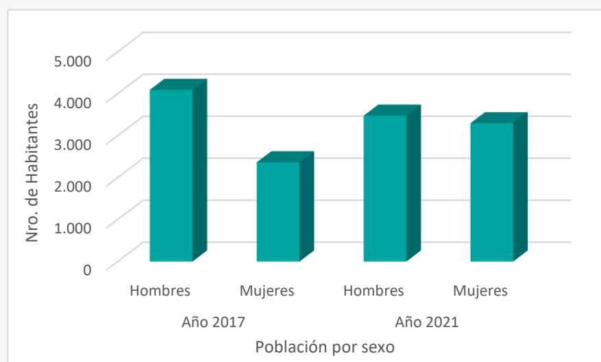
Población por sexo 2017 y proyección 2021, Comuna de María Elena.

Fuente: Elaborado a partir de resultados Censos de Población y Vivienda 2017 y proyecciones 2021, Instituto Nacional de Estadísticas (INE), Biblioteca del Congreso Nacional (BCN).