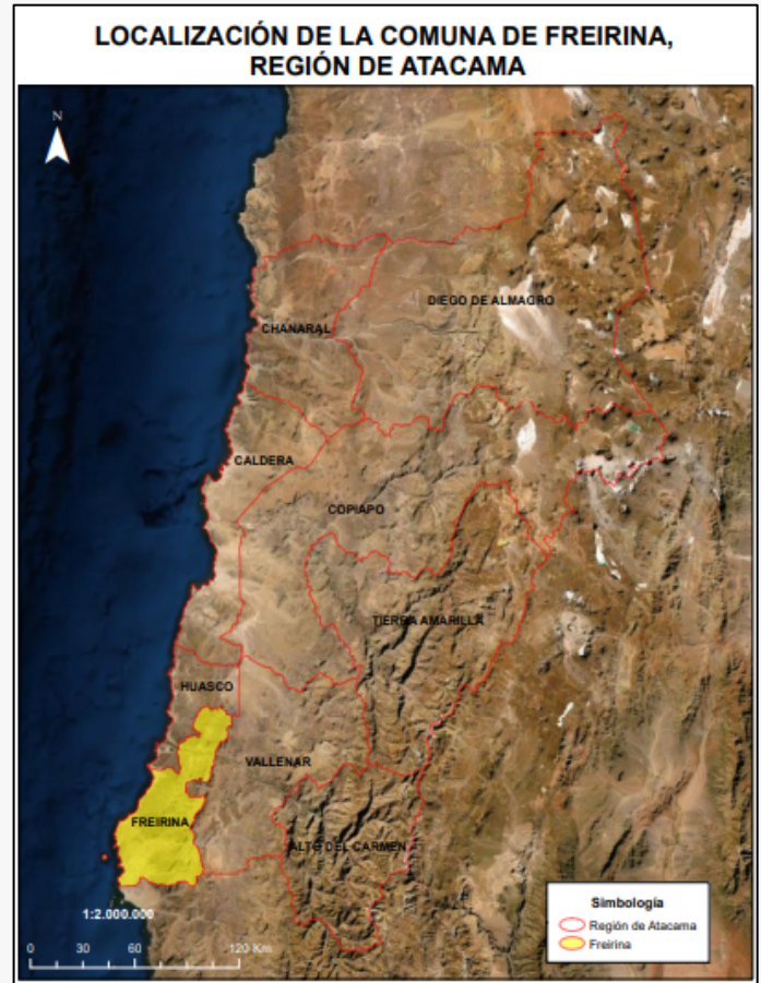
Límite comunal de Freirina.

De acuerdo con el Censo de Población y Vivienda realizado en el año 2017, la comuna de Freirina posee un total de 7.041 habitantes, de los cuales 3.557 son hombres y 3.484 son mujeres. Para el año 2021 se espera un incremento del 9,9%, arrojando un total de 7.739 habitantes (Biblioteca del Congreso Nacional, 2021).