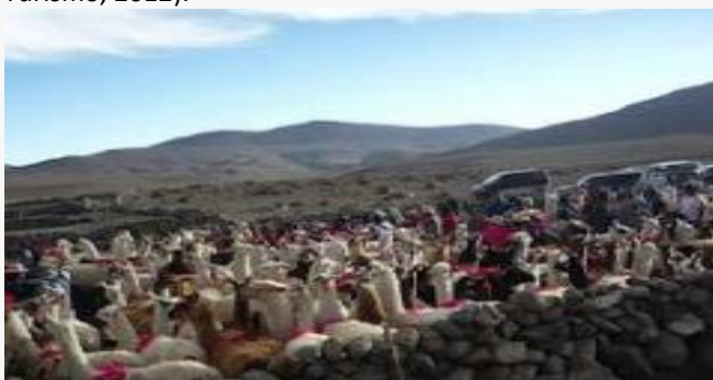
Floreo de animales de Colchane

En el mes de enero se inicia esta fiesta, que es el reconocimiento y heroseamiento de los animales domésticos como la llama y la alpaca, lo que sirve para “marcar” estos animales. Es una costumbre de carácter ritual, ancestral, de los pueblos originarios indígenas que habitan los sectores alto andino de América del Sur. Este ritual se realiza en todas las localidades aymaras de pastoreo de la comuna de Colchane (Servicio Nacional de Turismo, 2012).