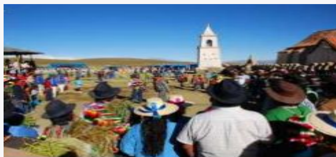
Carnaval de Isluga

Contempla una serie de actividades desde encuentros de los pueblos de Araksaya y Mankasay y pandillas de baile en la plaza del pueblo, lanzamiento de membrillos de parte de los caciques de Araksaya y Mankasaya a la campana del campanario de la Iglesia, el esperado munaypata donde se presenta al alferez del carnaval siguiente. Y las actividades finales se realizan el cuarto día donde se hace el recuento de regalos al alferez y se procede a efectuar las respectivas despedidas del Anata (Carnaval). Se realiza en febrero (Servicio Nacional de Turismo, 2012).