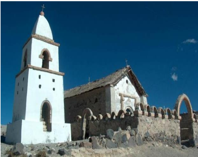
Iglesia de Cotasaya

Ancuaque es un pequeño poblado Aymara del altiplano de la región de Tarapacá, ubicado a 37 kilómetros de Colchane y a 10 kilómetros de Cariquima. Sus habitantes viven de la agricultura, ganadería, artesanía y turismo. Este poblado se encuentra en las faldas del nevado Cariquima o Mama Huanapa (Servicio Nacional de Turismo, 2012).