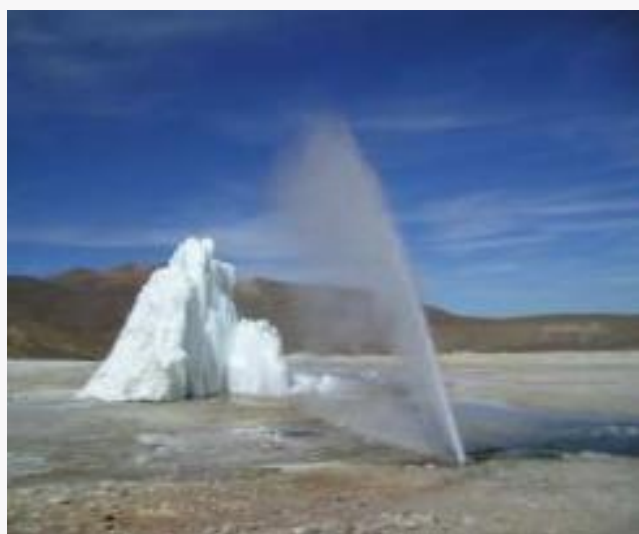
Geiser de Puchuldiza

Campo geotérmico ubicado a una altura de más de 4.000 msnm. Los geisers demuestran la fuerza de la naturaleza, con su caldera natural del subsuelo donde presenta un conjunto de pozas humeantes de agua caliente en constante ebullición. En invierno alcanzan una altura de 6 metros que por efecto del viento gélido forman un banco de hielo de hasta 10 metros de altura, único en su género. (Servicio Nacional de Turismo, 2012).