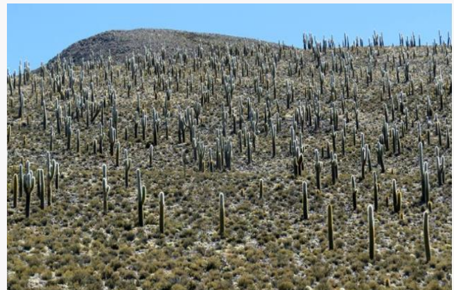
Bosque de cactus gigantes de Ancovinto

En la zona fronteriza de Colchane, en las laderas de los cerros de Ancovinto, es posible observar de cerca un bosque de cactus gigantes de hasta 10 metros de altura. Es una especie única (Servicio Nacional de Turismo, 2012).