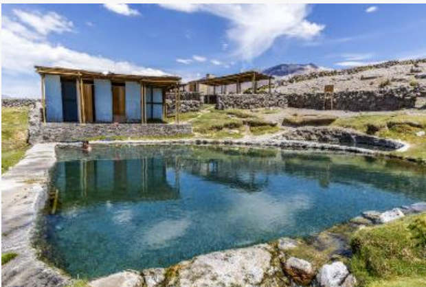
Termas de Enquelga

Sus instalaciones cuentan con camping y dos pozas naturales de aguas cristalinas que emergen a ras de suelo. Poseen como características de su agua hipotermales, temperaturas de 30° C ( https://bit.ly/3dnP0cl )