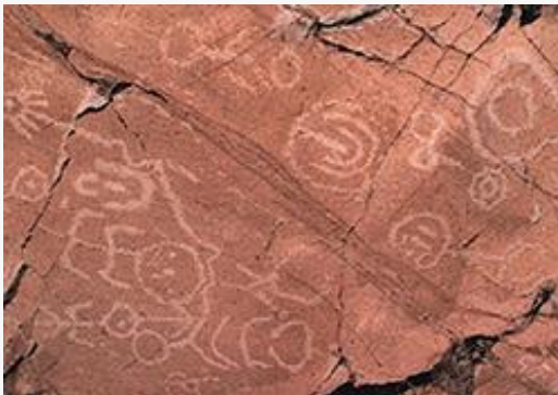
Petroglifos del Cipreses

Se ubican al interior de la Reserva Nacional río de los Cipreses. Son huellas del pasado que fueron dejadas por los pueblos prehispánicos. La Piedra del Indio, Carrizal, Cotón, Agua de la Vida y el rincón de los Guanacos, son algunos de los sitios en los cuales se encuentra este arte rupestre. Estos símbolos se remontan a 6.000 y 3.500 años antes de Cristo, y otros bastante más recientes (Servicio Nacional de Turismo, 2012).