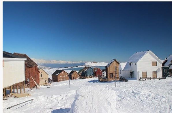
Centro de Ski Chapa Verde

El Centro de Ski Chapa Verde está ubicado en terrenos de CODELCO Chile, división El Teniente y se encuentra bajo la administración del Club de Ski Chapa Verde. Cuenta con 22 pistas para todo esquiador, con una extensión de entre 1.200 y 2.500 metros. Su dominio esquiable es de 1.200 hectáreas, las cuales se forman a partir de cinco andariveles, cuatro de arrastre y un telesilla triple, adaptados al nivel de cada persona (Servicio Nacional de Turismo, 2012).