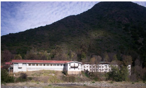
Termas de Cauquenes

El lugar posee un hermoso y antiguo hotel estilo gótico, donde es posible encontrar piscinas, tinas individuales, tinas de hidromasaje, además de las pozas naturales. (Servicio Nacional de Turismo, 2012).