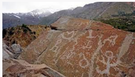
Arte rupestre Pangal

Pangal 1 pertenece al área arqueológica de Chile Central. Sitio con petroglifos. El valle del Cachapoal habría estado poblado por una fracción del pueblo mapuche y ya en la segunda mitad del siglo XV, hace aparición en la zona el Imperio Inca, tanto en términos militares como ideológicos. Dentro del sistema cosmológico y de creencias de los indígenas locales, las montañas poseían una especial significación. Pangal 1 está enmarcado por tres altas cumbres: el cerro Manantiales (3.510 metros), el cerro Agujas de Caracoles (2.400 metros) y el Socavones (2.609 metros) (Servicio Nacional de Turismo, 2012).