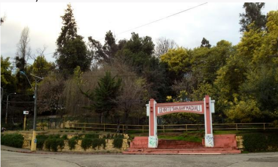
Cerrito San Juan

Es uno de los lugares de cita campestre más tradicionales de la región. Allí se realizan competencias típicas como domaduras, rodeos y amansaduras. En Fiestas Patrias se instalan las fondas y ramadas. Los que concurren a este cerro para disfrutar de un día de picnic, pueden complementarlo con caminatas y cabalgatas. En la laguna del cerro también pueden recrearse paseando en bote. Toda esta zona municipal está dotada de agua potable y servicios higiénicos, mesas de picnic y asaderas mientras que la naturaleza dota a este lugar de frondosa vegetación universo (Servicio Nacional de Turismo, 2012).