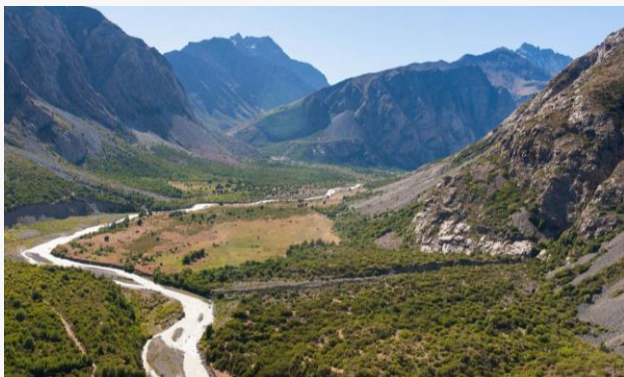
Reserva Nacional Río de Los Cipreses

Esta reserva fue creada en 1985 y es el resultado de una combinación de fenómenos volcánicos, glaciares y fluviales. Su principal cauce es el río de Los Cipreses, afluente del Cachapoal, pero también existen pequeñas lagunas en las zonas más altas del parque, tal es el caso de la laguna Agua de la Vida. Dentro de la reserva existen lugares de interés arqueológico, antropológicos e históricos dados por petroglifos (Servicio Nacional de Turismo, 2012).