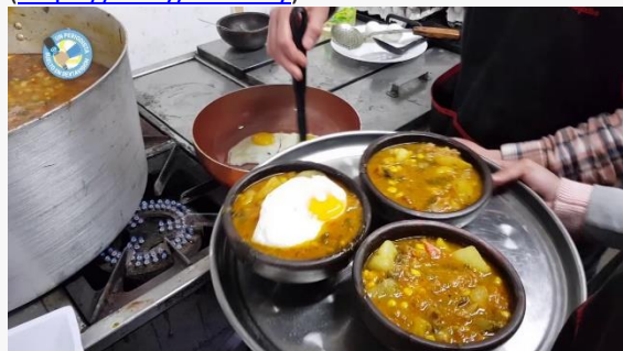
Fiesta del Charquicán en Chacayes

En noviembre se lleva a cabo esta fiesta en honor a este guisado colonial en el pueblo de Chacayes ( https://bit.ly/3vokxky ).