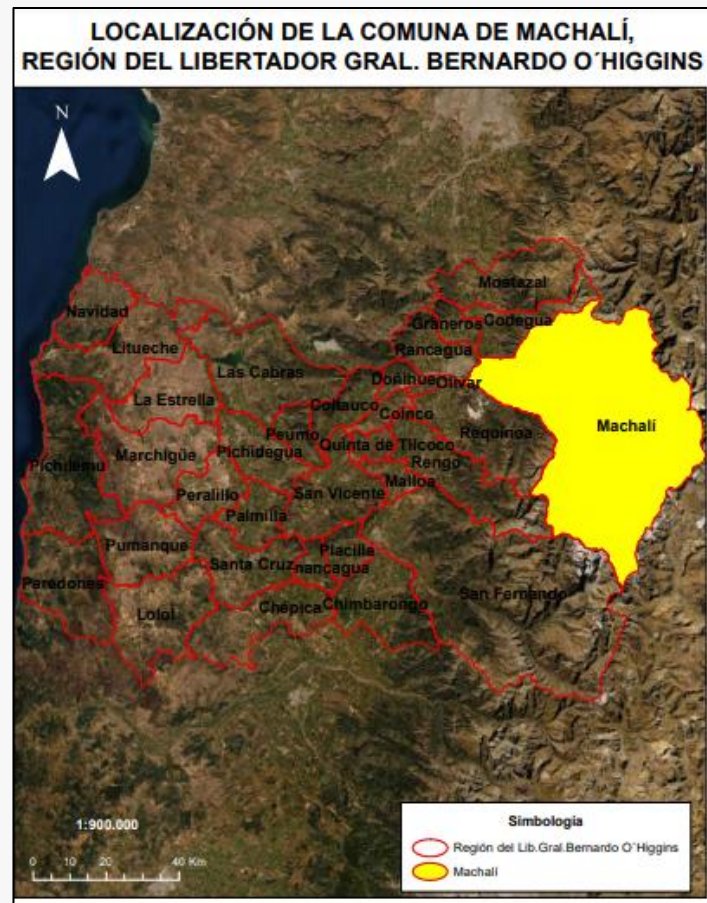
Límite comunal Machalí

la reorganización de la policía de Seguridad, la delimitación de los límites urbanos y la designación de los nombres de las calles Plan de Desarrollo Comunal de Machalí, 2010- 2014).