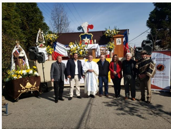
Fiesta de la Virgen del Carmen

Se realiza en el parque Los Tacos y es organizada por la municipalidad de Coltauco y organizaciones comunitarias, entre fines de marzo y principios de abril, celebrando el fin de las faenas agrícolas y frutícolas de los temporeros de la zona. La celebración reúne diversos exponentes del folclore chileno y actividades tradicionales como domaduras, concursos de cueca, desfile de huasos, gastronomía típica, elaboración de agua ardiente y chicha, entre otras actividades (Servicio Nacional de Turismo, 2012).