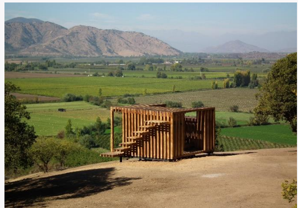
Mirador del Caminante Poqui

Se encuentra en el sector de Hijuela del Medio. En este lugar, se pueden realizar caminatas y excursiones, llevando al visitante hacia el cerro Poqui, donde es posible encontrar arroyos, cascadas y ríos, aptos para el baño. Desde una pequeña planicie el mirador cuenta con una vista panorámica sin precedentes ( https://bit.ly/2T6onkT ).