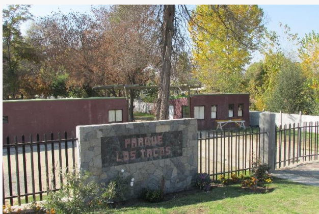
Parque Comunal Los Tacos

En este parque se realizan una serie de actividades que rememoran las costumbres de la localidad ( https://bit.ly/2T6onkT ).