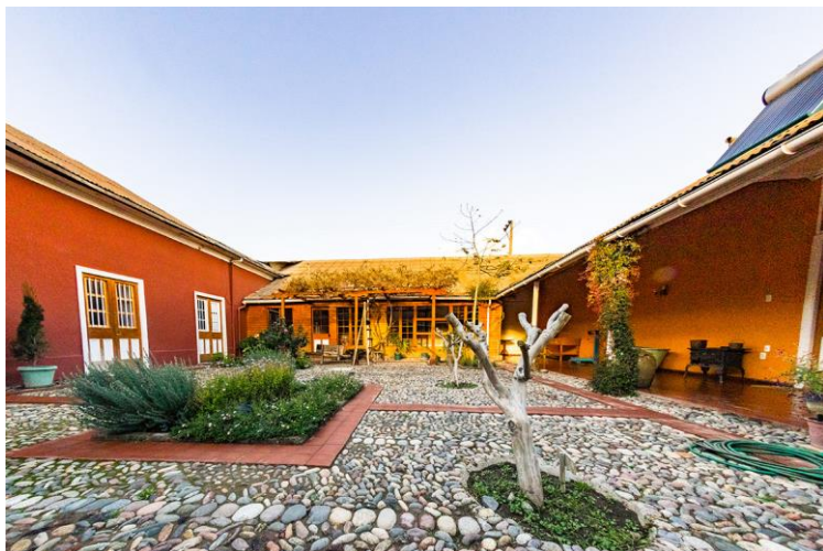
Figura N° 16 Museo El Solar de los Madariaga