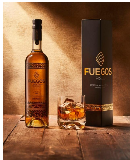
Figura N° 21 Pisquera ABA, Vicuña

Los piscos embotellados y listos para el mercado son exportados a Canadá, EEUU, Reino Unido, Suiza, Japón, China, Nueva Zelanda y el mercado nacional (Servicio Nacional de Turismo, 2012).