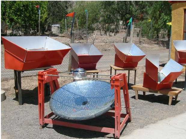
Figura N° 1 Artesanas solares de Villaseca, Vicuña

Uno de los casos más emblemáticos sobre como el uso de las cocinas solares puede mejorar la forma de vida de los pueblos que la utilizan es del pueblo chileno de Villaseca, en donde la necesidad, el ingenio, el sol y la tenacidad de sus mujeres, lograron que este sitio desértico pudiera salir adelante. En este lugar viven unas 110 familias que trabajan con los viñedos del sector. Un grupo de mujeres del pueblo recibió en sus casas las cocinas y hornos solares entregados por el Instituto de Nutrición y Tecnología de los Alimentos (INTA), que les enseñó a usar cocinas alimentadas por la energía solar (Servicio Nacional de Turismo, 2012).