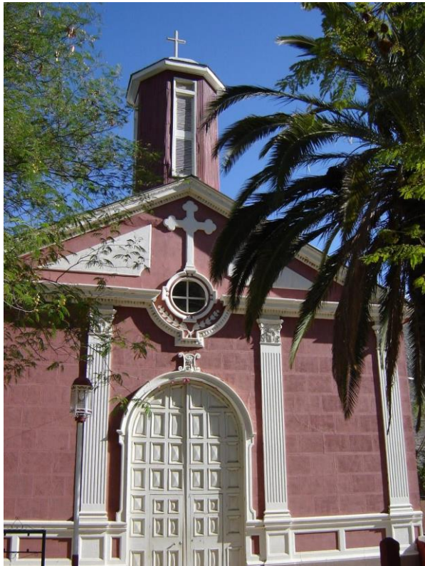
Figura N° 11 Iglesia de Diaguitas

La iglesia actual data del año 1867. Es de una nave de 40 metros de largo por 12 metros de ancho, murallas de adobe (Servicio Nacional de Turismo, 2012).