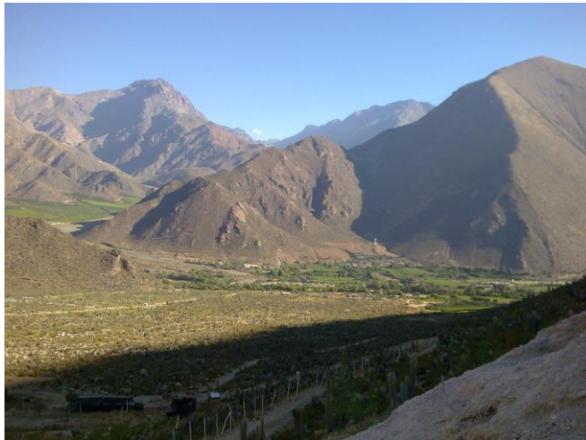
Figura N° 26 Andacollito, Vicuña

Ubicado frente a Diaguitas, posee una extensa calle que atraviesa el pueblo, en medio de hermosos paisajes.