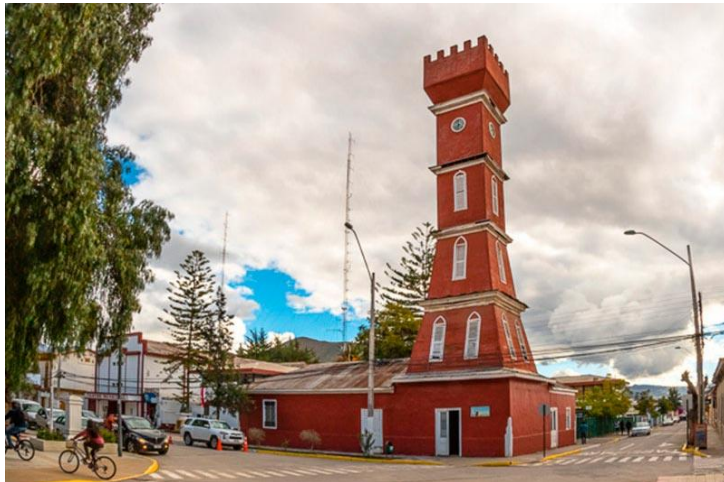
Figura N° 22 Torre Bauer, Vicuña