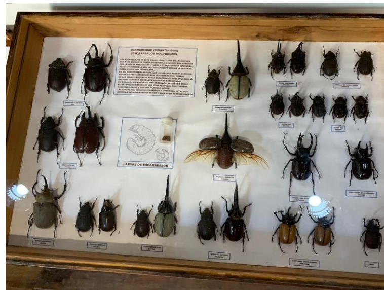
Figura N° 17 Museo Entomológico e Historia Natural

Posee una colección con más de 26.000 piezas dividida en distintas áreas: entomología, paleontología, malacología y ornitología. Se ha formado por más de 20 años por Guido Castillo. Posee la colección privada de insectos más grande de Chile albergando fósiles, mariposas, escarabajos, caracolas, aves del valle entre otras especies (Servicio Nacional de Turismo, 2012).