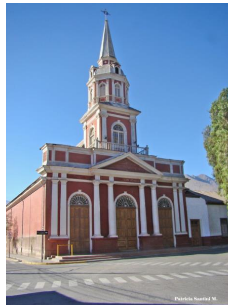
Figura N° 14 Iglesia Inmaculada Concepción de Vicuña

provenientes de la zona. Entre sus posesiones cuenta, además, con la pila bautismal donde recibiera los primeros óleos la poetisa Gabriela Mistral (1889). De forma esporádica, funciona una sala de exhibición de antiguas imágenes y enceres religiosos empleados en el alle (Servicio Nacional de Turismo, 2012).