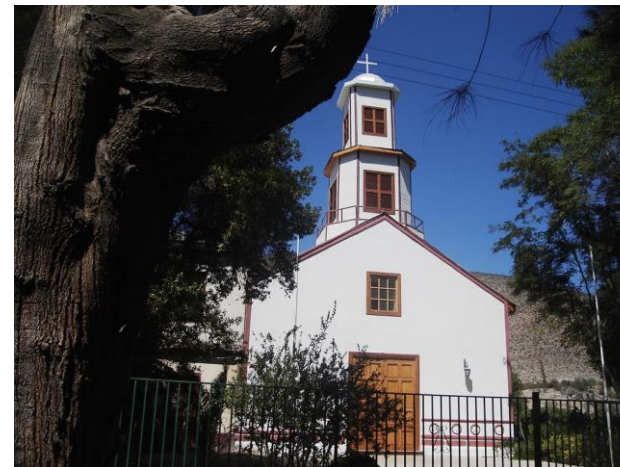
Figura N° 12 Iglesia de El Tambo

Esta iglesia, una de las más antiguas de Chile, fue destruida por un incendio el año 2004. Su reconstrucción fue posible gracias al esfuerzo de la propia comunidad y de la fundación Ayuda a la Iglesia que Sufre (AIS), que en el marco de su campaña “Capillas para Chile” construye iglesias en los lugares más necesitados de nuestro país. La primera construcción de la iglesia de El Tambo se remonta al siglo XVI, siendo la más antigua del valle del Elqui. En sus inicios estuvo dedicada a San Ildefonso, patrono de Toledo (Servicio Nacional de Turismo, 2012).