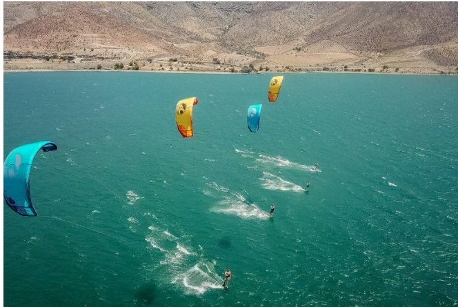
Figura N° 9 Embalse Puclaro

2.508 predios con un tamaño medio de 8 hectáreas (Servicio Nacional de Turismo, 2012).