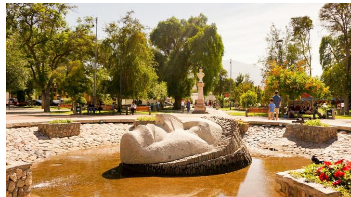
Figura N° 25 Plaza Gabriela Mistral (Ex Plaza de Armas), Vicuña

Destaca por sus añosos árboles de protectoras sombras, sus anchos pasillos y cómodas bancas, su gran escenario y sus bellas esculturas. De estas últimas, la principal es un gran rostro esculpido en piedra de Gabriela mirando hacia el cielo que ocupa el centro de la plaza desde 1971 ( Turismo Región de Coquimbo ).