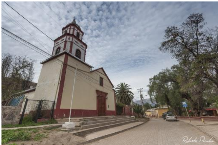
Figura N° 13 Iglesia de San isidro

Iglesia de piso de madera de algarrobo. En San Isidro estuvo la primera sede de la parroquia de Vicuña (Servicio Nacional de Turismo, 2012).