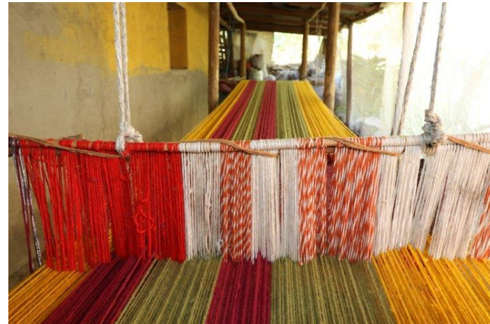
Figura N° 2 Artesanos de Chapilca

Chapilca es un pequeño pueblo de la región de Coquimbo, donde una gran parte de la población se dedica a la artesanía textil trabajada con lana de oveja hilada a mano y teñida con productos naturales, como la mollaca, el pacul, la cáscara de nuez y la resina de algarrobo. En la tradición de los tejedores de Chapilca, destaca el trabajo con un telar horizontal de origen indígena que se acciona a pedales; y entre las obras que desarrollan estos artesanos es posible hallar alfombras, cojines y mantas. En su diseño figuran colores intensos y franjas verticales (Servicio Nacional de Turismo, 2012).