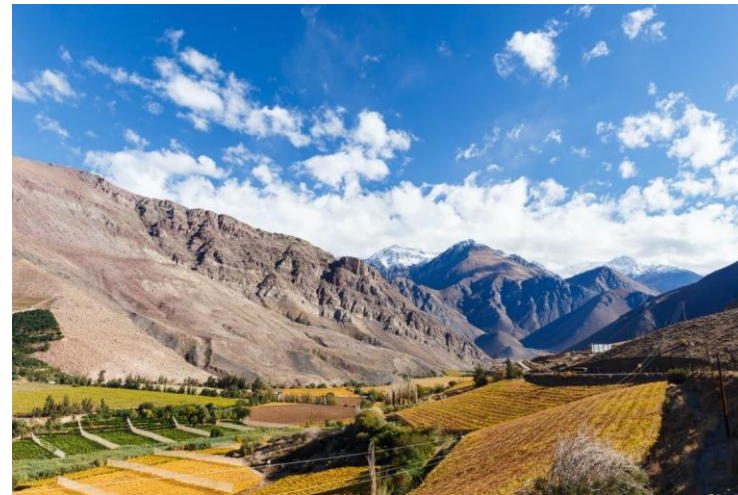
Figura N° 23 Valle del Elqui, Vicuña

Se encuentra rodeado por hermosos cerros que le cobijan. Se puede disfrutar de las hermosas riberas del río Claro, afluente del río Elqui, con sus aguas claras y preciosos parajes (Servicio Nacional de Turismo, 2012).