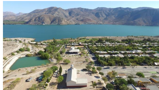
Figura N° 10 Gualliguaica

Su costanera es el lugar ideal para observar en su totalidad el embalse y parte del antiguo Gualliguaica, hoy sumergido bajo las aguas de esta represa artificial. Posee la réplica de una antigua iglesia que fuera construida en 1757, un interesante museo con la historia del pueblo y otra réplica de lo que fue la original estación de trenes construida en 1897 ( Turismo Región de Coquimbo ).