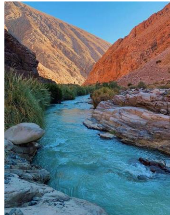
Figura N° 20 Río Turbio, Vicuña

El río Turbio se forma a 43 kilómetros aguas arriba de Rivadavia y a 1.370 [msnm], de la unión de los ríos Toro y La Laguna, drenando un área de 4.196 km 2 . A partir de la confluencia de sus tributarios, toma rumbo al noroeste y a la altura del pueblo de Guanta, describe un gran arco para definir un rumbo final nortesur, que es la prolongación del rumbo que trae la quebrada tributaria del Calvario (Servicio Nacional de Turismo, 2012).