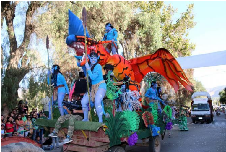
Figura N° 27 Carnaval Elquino, Vicuña

Desde hace más de 100 años contempla elección de reina, espectáculos artísticos, actividades culturales, bailes populares y un gran corso de flores con desfile de carros alegóricos y disfraces ( Turismo Región de Coquimbo ).