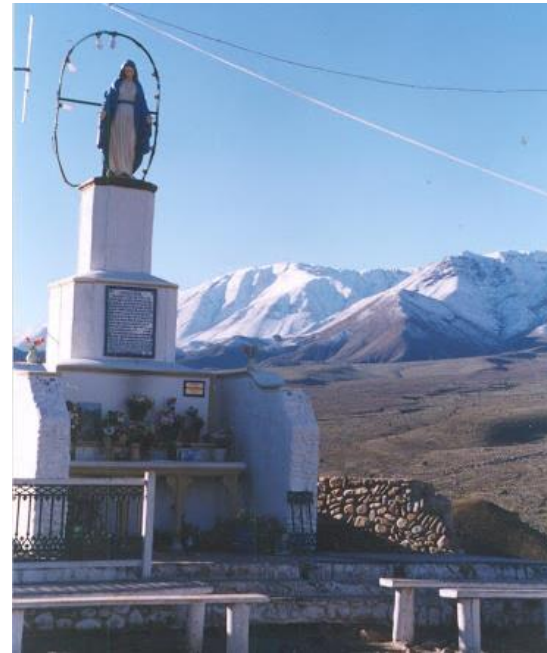
Figura N° 4 Cerro La Virgen

Es un mirador natural desde donde se logra una hermosa vista panorámica de la ciudad y del valle que la contiene. Sitio ideal para sacar fotografías. También es un lugar de peregrinación religiosa (Servicio Nacional de Turismo, 2012).