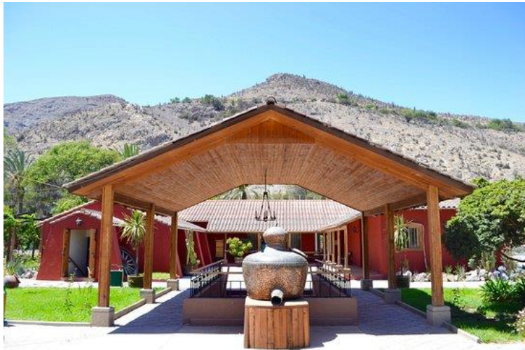
Figura N° 3 Centro Turístico Planta Capel

Esta empresa pisquera ofrece visitas guiadas en su centro turístico, donde da a conocer el proceso de elaboración y embotellado del pisco (Servicio Nacional de Turismo, 2012).