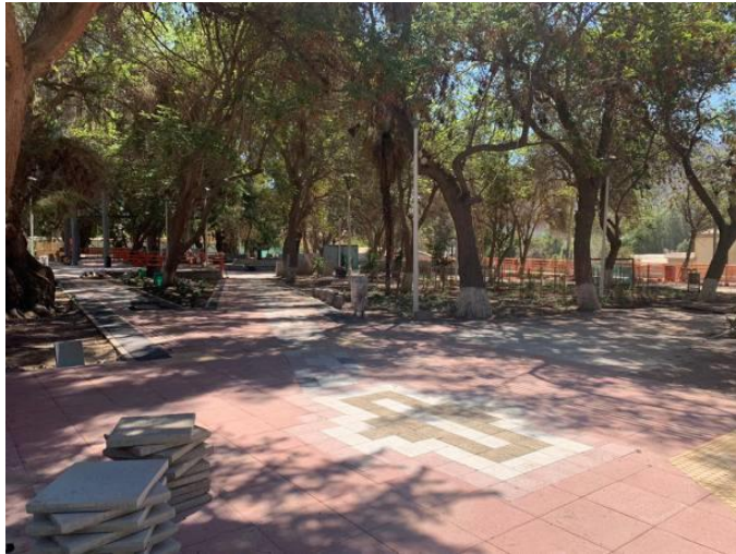
Figura N° 7 El Tambo, Vicuña