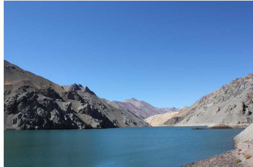
Figura N° 8 Embalse La Laguna

Tiene una capacidad de 40 millones m^3 , con aproximadamente 5 kilómetros de extensión y una altura de 3.350 [msnm]. Este embalse constituye la reserva hídrica para el valle del Elqui. Ubicado camino al paso internacional de Agua Negra (Servicio Nacional de Turismo, 2012).