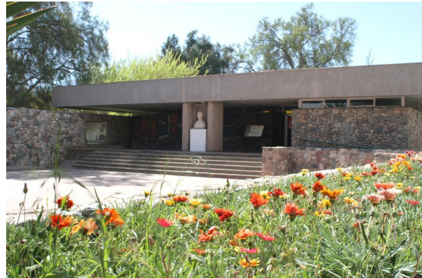
Figura N° 15 Museo Biblioteca y Casa de Gabriela Mistral, Vicuña

Posee la mayor colección de objetos relacionados a Gabriela Mistral, incluyendo artículos personales y obsequios que recibió a lo largo de su vida. Además, en su biblioteca se conservan cientos de libros que pertenecieron a la poeta, en muchos de los cuales se observan anotaciones de puño y letra ( Turismo Región de Coquimbo ).