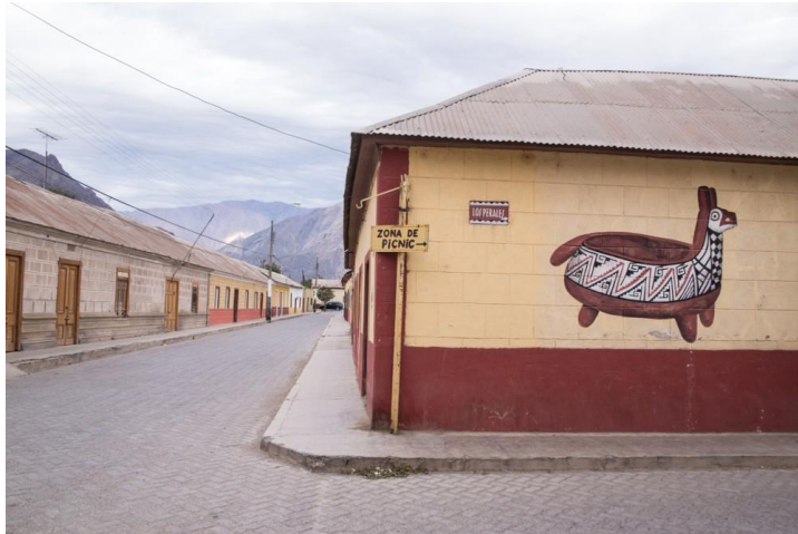
Figura N° 5 Diaguitas, Vicuña

visitante puede conocer la fabricación, producción y degustación a través de tours guiados en dicha localidad (Servicio Nacional de Turismo, 2012).