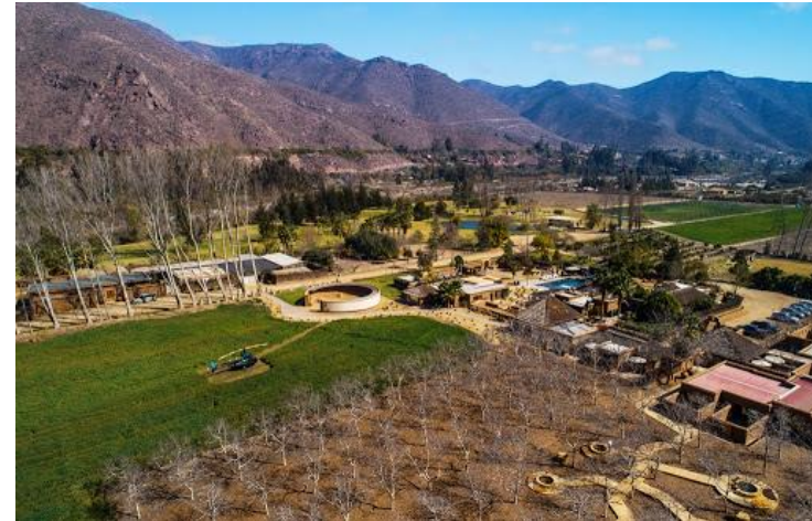
Figura N° 6 El Molle, Vicuña

sus complejos turísticos para la relajación y sus actividades ecuestres (Servicio Nacional de Turismo, 2012).