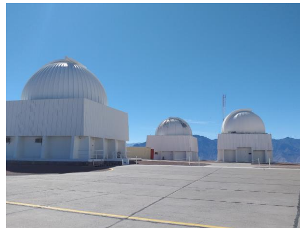
Figura N° 19 Observatorio Astronómico Cerro Tololo

El Observatorio Interamericano de Cerro Tololo es un complejo científico compuesto de telescopios e instrumentos dedicados a la observación astronómica profesional localizado a una altitud de 2.200 metros en el cerro Tololo. El desarrollo del Observatorio Interamericano de Cerro Tololo se inició en el año 1963, después de una extensiva búsqueda de tres años, con el fin de seleccionar un lugar apropiado en el hemisferio austral, para la observación de los cielos jamás visibles desde el norte. Con 320 kilómetros cuadrados de terreno circundante, el observatorio es operado por la Asociación de Universidades para la Investigación en Astronomía (AURA) (Servicio Nacional de Turismo, 2012).