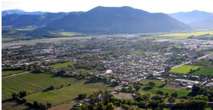
Figura N° 24 Vicuña

1872, obtiene el título de ciudad y pasa a llamarse simplemente Vicuña, en honor a su fundador. Vicuña también es conocida como la capital del valle de Elqui y del pisco chileno, además de ser el lugar de nacimiento de la poetisa chilena Gabriela Mistral, ganadora del Premio Nobel de Literatura en el año 1945 (Servicio Nacional de Turismo, 2012).