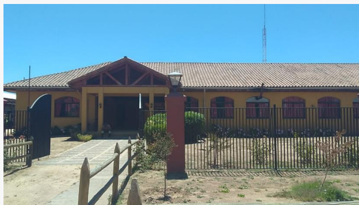
Centro cultural de Pumanque

Fue habilitado como tal durante el año 2013, convirtiéndose en el principal gestor, productor y ejecutor de actividades artísticas culturales que se desarrollan en la comuna (Catálogo Cultural de Pumanque, 2014).