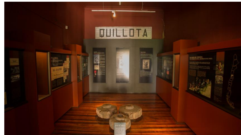
Figura N° 5 Casa Colonial.

Declarada Monumento Histórico D.S. 556 del 10/06/1976. Data de 1722, lo que la hace la más antigua de la ciudad. (SERNATUR, 2012).