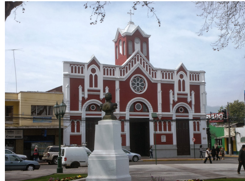
Figura N° 7 Templo Santo Domingo.

Sus columnas y altar están pintados simulando mármol. En él se puede visitar el sepulcro de la “Beatita Benavides” y el Patio Portales (SERNATUR, 2012).