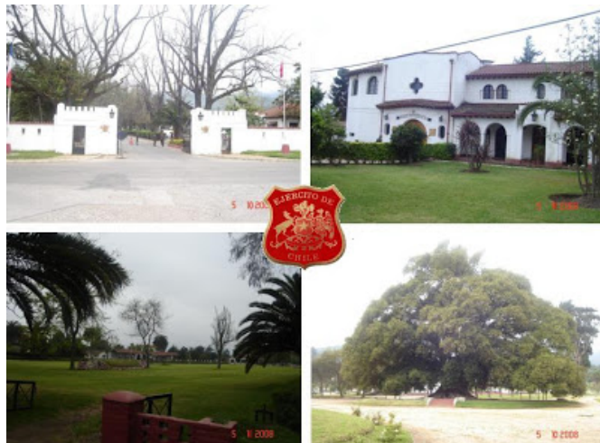
Figura N° 4 Escuela de Caballería.

La Escuela de Caballería se instaló en 1935, luego que la hacienda fuera vendida al Ejército. En 1994 se inauguró el museo en su interior. En sus jardines se encuentra la réplica del record mundial en salto alto, realizado por el entonces Capitán Alberto Larraguibel, en su caballo “Huaso”. Anualmente se realizan competencias ecuestres y de polo, con la participación de jinetes militares y civiles (SERNATUR, 2012).