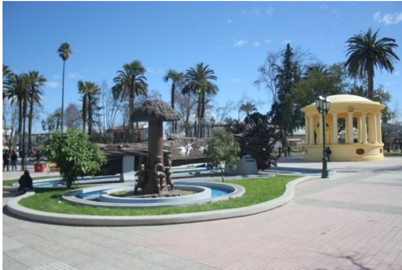
Figura N° 2 Plaza de Armas.