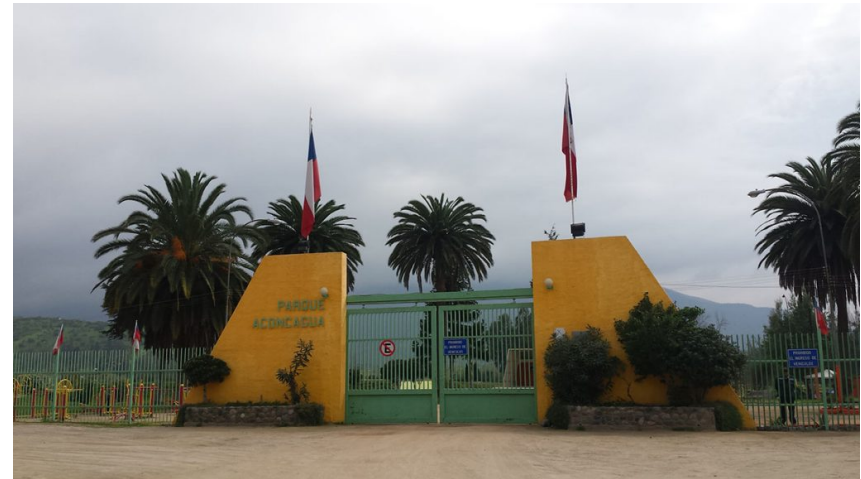
Figura N° 11 Parque Aconcagua, Quillota.

Casi al llegar al río Aconcagua, este centro recreativo, cuenta con juegos y zonas de picnic.