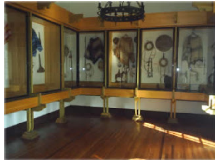
Figura N° 3 Museo Casa del Huaso.

Rodeo Federado y Campesino de la provincia de Quillota y precisamente han sido sus propios socios los que por medio de aportes implementaron esta muestra tradicional. El museo puede ser visitado para admirar aperos, trofeos, medallas, espuelas y estribos chapados en plata, chamantos antiguos, tipos de riendas, monturas, silla española de dama y estribos, (SERNATUR, 2012).