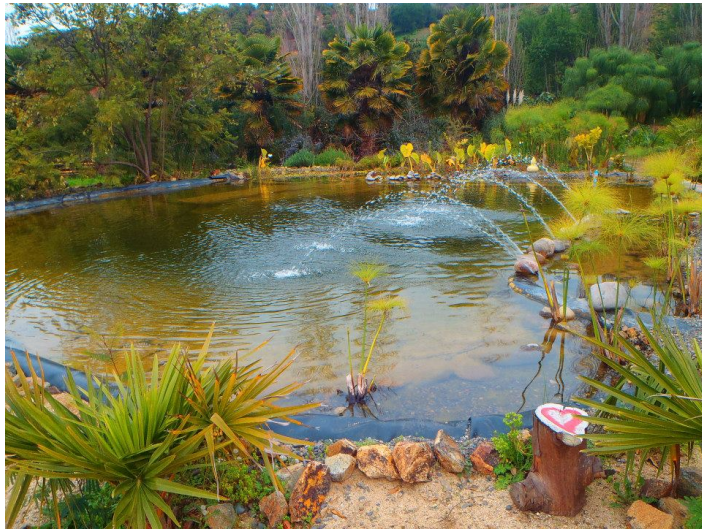
Figura N° 12 Jardín Botánico El Escalante.

Avanzando por calle La Concepción hacia el poniente, se encuentra este jardín con más de mil especies de cactáceas y una colección de 15 especies de orquídeas.