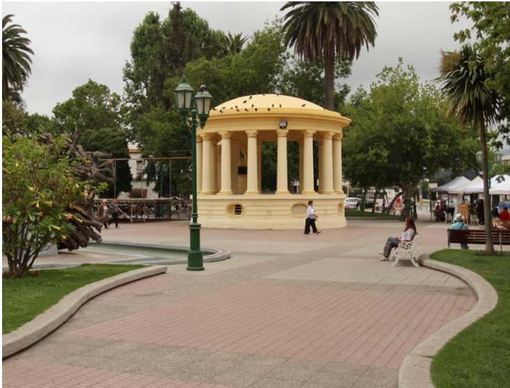
Figura N° 8 Odeón de Plaza de Armas de Quillota.

Este odeón, cuenta con bellas columnas romanas de diseño neoclásico, el Odeón del desfile de Quillota fue un donativo a la colectividad por los habitantes italianos asentados en la ciudad. Esta zona es usada por conjuntos musicales ( http://bit.ly/2kAtx7G ).