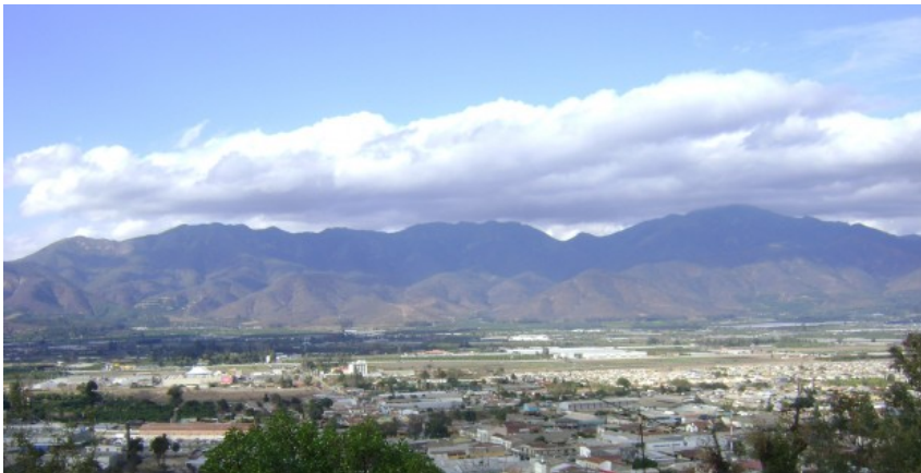
Figura N° 1 Quillota.

El 11 de noviembre de 1717, fue fundada la villa de Quillota, por el Gobernador interino de Chile Don José de Santiago Concha y Salvatierra, instancia verificada por el Obispo Luis Romero, en la misma fecha. Durante la colonia la ciudad tuvo gran importancia militar y administrativa debido a su ubicación entre la capital y el puerto de Valparaíso (Servicio Nacional de Turismo, SERNATUR, 2012).