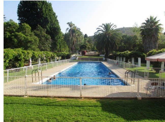
Figura N° 9 Centro Turístico “El Edén”.

Es un fundo de 38 hectáreas, rodeado de bosques, para disfrutar por el día o un período vacacional. Cuenta con áreas verdes, restaurante, cabañas, piscinas, salones de eventos y zona de picnic. Abierto todo el año, sin embargo, la piscina funciona solo en la temporada de verano ( http://bit.ly/2kqMTfL ).