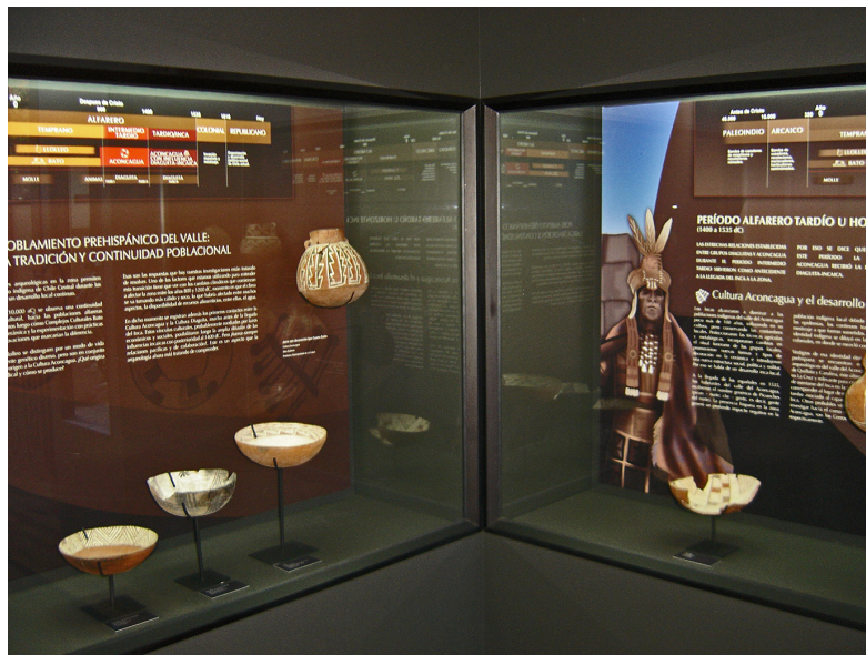
Figura N° 6 Museo Arqueológico de Quillota.

El Museo Histórico-Arqueológico de Quillota es una entidad de carácter Municipal creada oficialmente el 05 de diciembre de 1997, por iniciativa del Taller de Investigación de la Historia y Geografía de Quillota, para rescatar la tradición Patrimonial Histórica y Arqueológica de la ciudad. (SERNATUR, 2012).