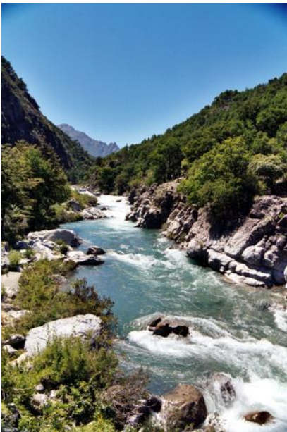
Figura N° 8 Valle Ancoa, Linares

Es un valle precordillerano formado por el río del mismo nombre y que posee sectores ideales para realizar caminatas, cabalgatas y pesca (Servicio Nacional de Turismo, 2012).