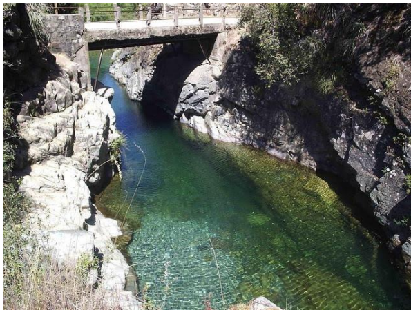
Figura N° 6 Rio Ancoa, Linares

El declive en este trayecto es de 19 metros por kilómetro. El turista que se dirige hasta el final del camino, encontrará el refugio El Melado, sector apreciado por los mochileros debido a su ubicación. Desde ahí, se pueden realizar tours por sus alrededores, que abarcan la Reserva Nacional Los Bellotos con sus cascadas, lagunas, cabalgatas y rafting (Servicio Nacional de Turismo, 2012).