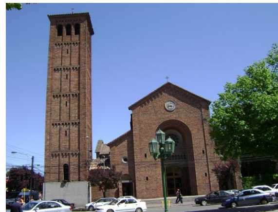
Figura N° 2 Catedral de Linares

Su construcción fue basándose en el modelo de la Basílica de San Ambrosio, en Milán, construcción noble y de estilo Romántico. Quien concibió la nueva Catedral e inició sus obras fue el visionario Obispo de Linares, Monseñor Juan Subercaseaux Errázuriz. Con el terremoto del 27 de febrero del año 2010, la Catedral sufrió daños que se apreciaron desde el exterior del templo, principalmente ladrillos que cayeron desde su torre principal y el desplome de la cruz que se ubicaba en el centro de la edificación (Servicio Nacional de Turismo, 2012).