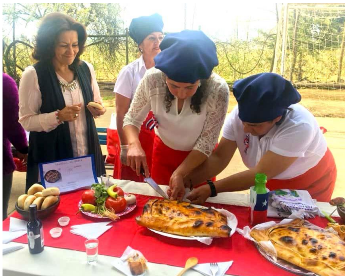
Figura N° 9 Muestra Gastronómica, Linares.

Durante la primera semana de diciembre, se lleva a cabo una de las muestras gastronómicas más importantes de Linares. En ella, sus participantes exponen los platos típicos y sus mejores especialidades ( https://bit.ly/3badnHI ).