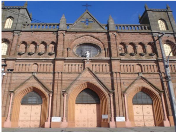
Figura N° 4 Parroquia Corazón de María, Linares