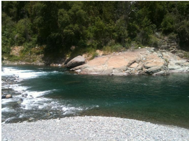
Figura N° 1 Cajón de las Vegas de Salas, Linares

Se caracteriza por ser un paraje de gran belleza escénica y conservar paisajes y formas de vida de aire colonial. Se accede por un camino de tierra que en parte de su trayecto bordea el río Achibueno. (Servicio Nacional de Turismo, 2012).