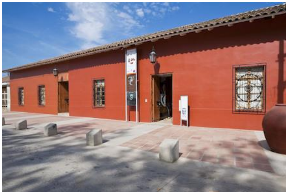
Figura N° 3 Museo de Arte y Artesanía de Linares

Fundado el 12 de octubre de 1966, la casa donde se ubica el museo fue declarada Monumento Histórico D.E. 389. Sus colecciones se formaron gracias a la generosidad de los artistas nacionales que reunieron más de 200 obras de arte, abarcando un período centenario de producción plástica nacional (1880-1980). Se suman los aportes realizados por el por el Museo Histórico Nacional y el de Bellas Artes (Servicio Nacional de Turismo, 2012).