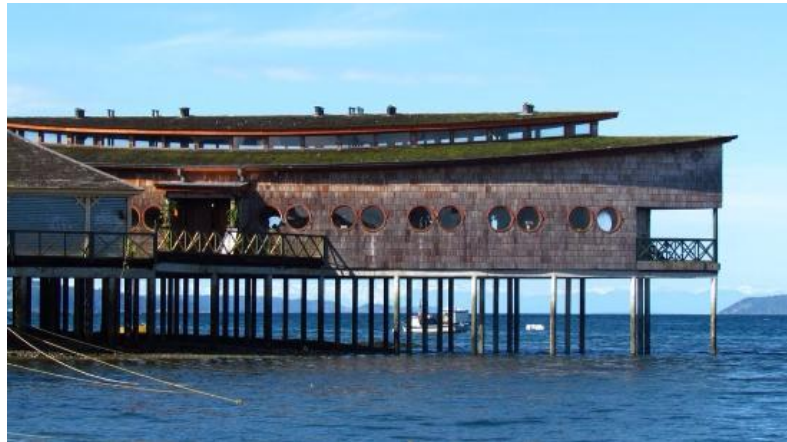
Figura N° 4 Cocinerías de Dalcahue

componen los productos del mar y la agricultura local, con el sabor de la sabiduría de las mujeres isleñas (Plan de Desarrollo Comunal 2015-2018).