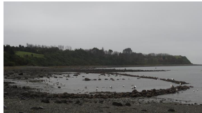
Figura N° 5 Corrales de Pesca.

estratégicamente para la recolección de mariscos y peces, corresponden a una antigua técnica aún utilizada por locatarios que conocen de ella. Para poder observar de mejor manera la estructura de los corrales de pesca, se puede ingresar a un sendero privado, el cual cuenta con un mirador que permite observar precisamente sobre estos vestigios (Servicio Nacional de Turismo, 2012).