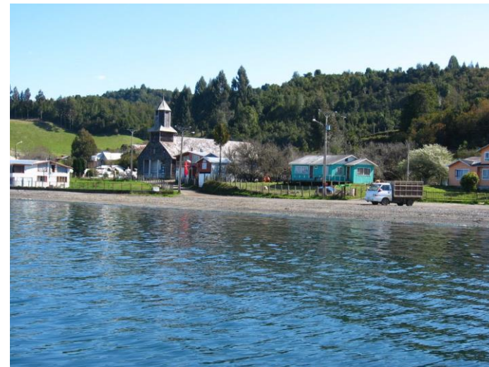
Figura N° 2 Calen

relativa cercanía a las islas menores de Lin-Lin, Llingua y Meulín. En 1608, se inició el proceso de evangelización en el archipiélago y Calen pasa a ser uno de los puntos estratégicos de los misioneros jesuitas. Con el correr del tiempo, pasó a tener una gran importancia histórica, social, cultural, religiosa y económica a nivel local. Hoy, la agricultura y en especial los trabajos acuícolas constituyen la vida laboral de los habitantes (Servicio Nacional de Turismo, 2012).