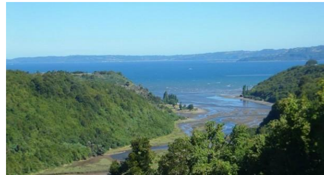
Figura N° 8 Humedal de San Juan

marea baja y así seguir alimentándose. Se caracteriza por la gran cantidad de cisnes de cuello negro que residen permanentemente en este lugar ya que es uno de los principales sectores de nidificación de esta especie dentro de la provincia de Chiloé (Servicio Nacional de Turismo, 2012).