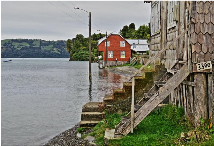
Figura N° 16 Quíquel