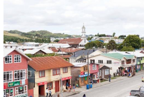
Figura N° 6 Dalcahue.

Dacapulli como era conocida en ese entonces, buscando un lugar apropiado como puerto de resguardo ( https://bit.ly/3doriew ).