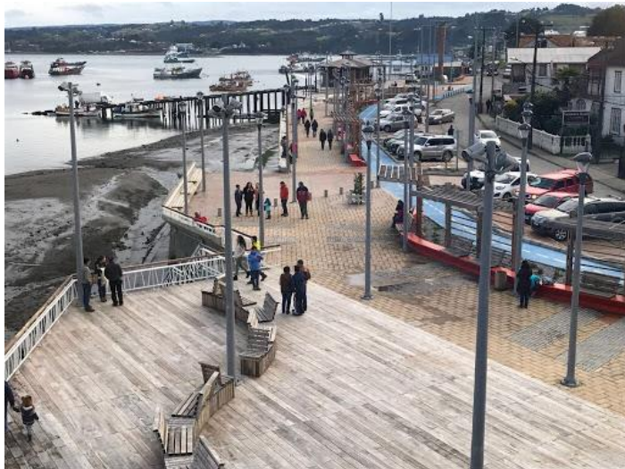
Figura N° 20 Costanera de Dalcahue

La costanera de Dalcahue, en la avenida Pedro Montt, tiene dos de los atractivos más comunes que hay en las ciudades chilenas que, dependiendo de su oferta, le dan una cuota de identidad muy propia a cada lugar ( https://bit.ly/2Uylcj1 ).