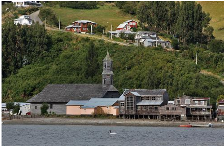
Figura N° 17 San Juan

Sus habitantes se encuentran vinculados al mar y la navegación y son poseedores de un valioso patrimonio cultural (Servicio Nacional de Turismo, 2012).