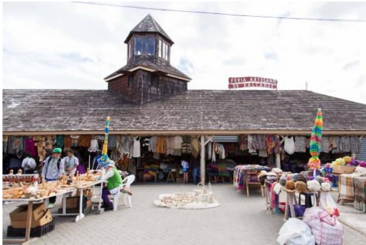
Figura N° 21 Feria Artesanal de Dalcahue.