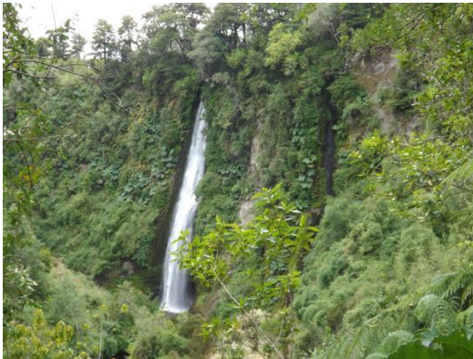
Figura N° 3 Cascada de Tocoihue

místico, originando leyendas como, por ejemplo: quienes eran bañados en esta cascada, serían brujos siempre y cuando permanecieran 12 horas bajo el agua y eliminar el bautismo católico. El curso de esta cascada, finaliza en el estero de Tocoihue con desembocadura al mar. (Servicio Nacional de Turismo, 2012).