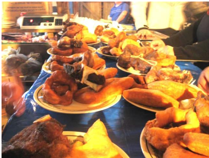
Figura N° 23 Fiesta Reitimient o del Reite de Dalcahue

típicos, se contempla la actuación de grupos folclóricos, rancheras campesinas y bailes de la zona ( https://bit.ly/3bvNYI3 ).