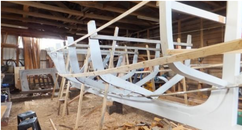
Figura N° 1 Astilleros de Dalcahue

estudiosos se interesen por este sector (Servicio Nacional de Turismo, 2012).