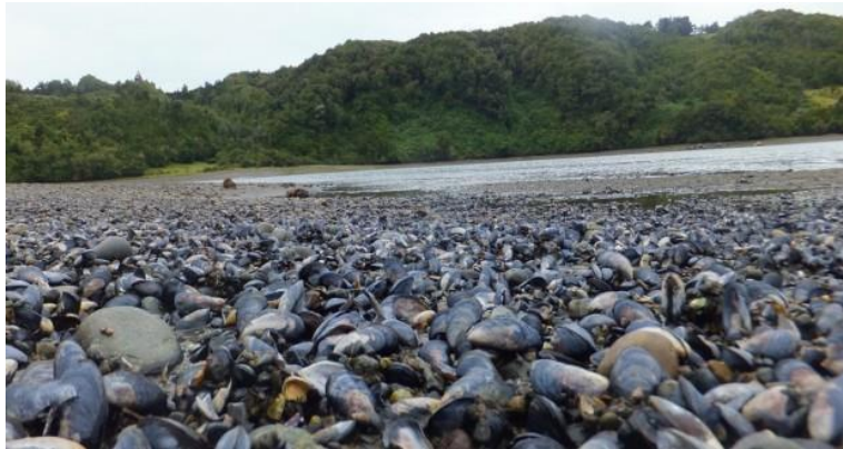
Figura N° 9 Humedal de Tocoihue

El humedal se encuentra habitado por una gran diversidad de especies marinas y aves que, en algunas épocas del año, migran desde Alaska. El humedal forma parte de la cultura del sector, ya que ha sido una fuente de provisión de alimentos para los habitantes (Servicio Nacional de Turismo, 2012).