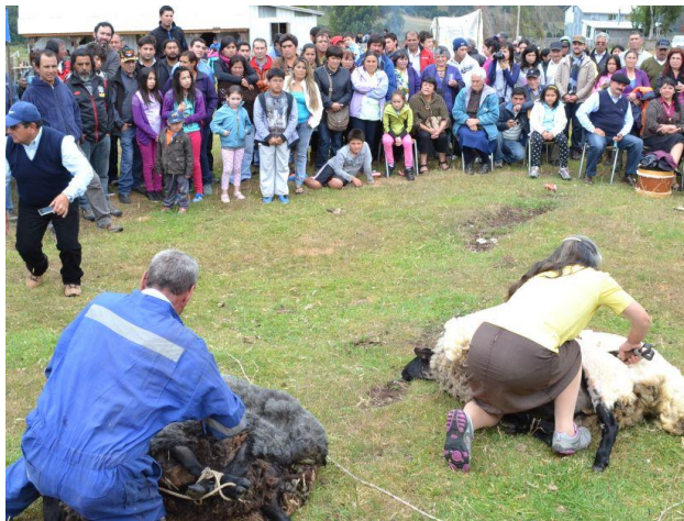
Figura N° 25 Muestra Costumbrista de Tenaún Alto

A 36 kilómetros de distancia de Dalcahue, en la localidad de Tenaún Alto, se realiza esta muestra que dura toda la primera semana de enero. Es un evento costumbrista, que se traduce en la exposición de gastronomía, folclore y juegos típicos de la zona ( https://bit.ly/2UqX4ia ).