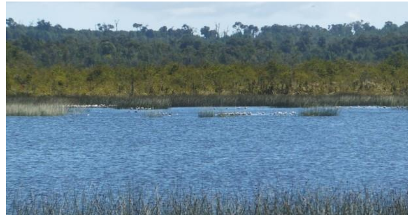
Figura N° 14 Laguna Los Caulles.

migratorias, las cuales arriban entre septiembre y noviembre, anidan, y luego emprenden rumbo nuevamente. La estadía de estas aves en la Laguna Los Caulles, se repite año a año sin excepciones, lo que la hace un lugar imperdible para quienes practiquen el avistamiento de aves. El acceso a esta laguna, se encuentra dentro de un terreno privado, sin embargo, los propietarios del lugar permiten el acceso a este refugio natural, pues lo consideran una manera de poner en valor el patrimonio natural de Chiloé (Servicio Nacional de Turismo, 2012).