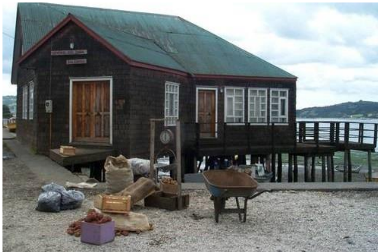
Figura N° 15 Museo Etnográfico de Dalcahue

Orientado a la historia de las etnias Chonos y Huilliches o Veliches, el museo muestra dentro de una misma sala, diversidad de colecciones que dan cuenta de la evolución del pueblo chilote a través del tiempo, sus actividades de agricultura familiar, artesanía y pesca. Se encuentra abierto durante todo el año en horarios de 08:00 a 17:00 horas (Servicio Nacional de Turismo, 2012).