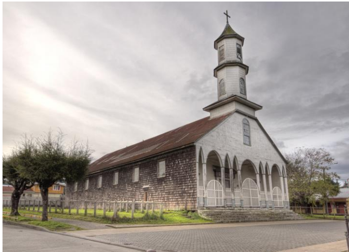
Figura N° 11 Iglesia “Nuestra Señora de los Dolores”.

ellas es la Iglesia de Dalcahue. Ésta fue construida en 1858 sobre el emplazamiento de la primera capilla de misiones levantada por los jesuitas a fines del siglo XVII. Su material de construcción es en su totalidad de madera trabajada con la técnica propia de las actividades locales de armadores y astilleros. Las obras de consolidación de la torre se realizaron a fines de 1981. Actualmente el cuerpo mismo de la iglesia y su pórtico están en precario estado de conservación (Servicio Nacional de Turismo, 2012).