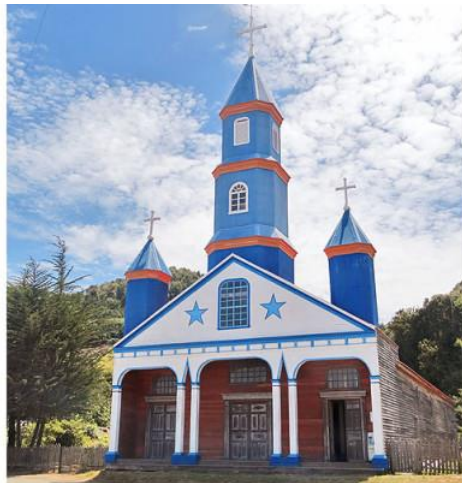
Figura N° 12 Iglesia de Tenaún “Nuestra Señora del Patrocinio”

La iglesia fue declarada Monumento Nacional de acuerdo con el Decreto Supremo N°222, el 10 de agosto de 1999, y declarada Patrimonio de la Humanidad por la UNESCO, el 30 de noviembre del 2000. (Servicio Nacional de Turismo, 2012).