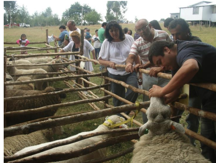
Figura N° 24 Fiesta Ovina de Puchauran

Esta muestra, contribuye al conocimiento de nuevas razas ovinas, y a su vez entregar un elemento muy significativo para las familias, que generan una oportunidad de ingreso, vendiendo artesanías de lanas de ovejas y platos de cordero.