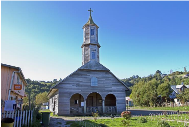
Figura N° 13 Iglesia San Juan