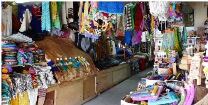
Figura N° 26 Encuentro Provincial de Artesanos Chilotes