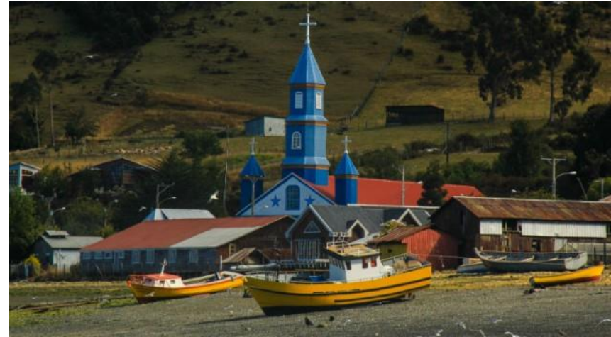
Figura N° 18 Tenaún

navigaciones a la isla Mechuque (Servicio Nacional de Turismo, 2012).