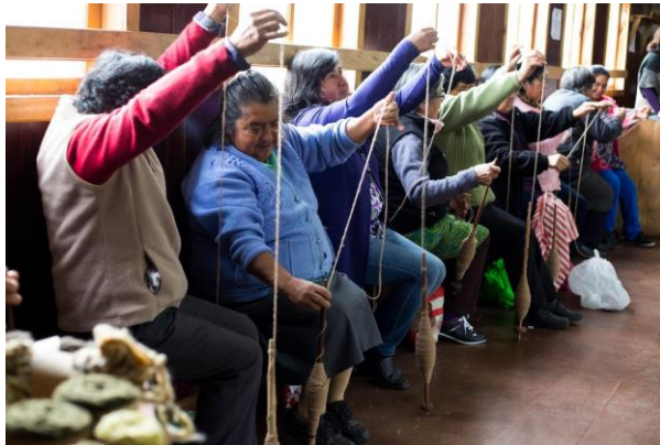
Figura N° 7 Hilanderas de Tenaún

ideales para confeccionar fajas o guiñiporras chilotas. Este grupo realiza la venta de hilado 100% naturales (Servicio Nacional de Turismo, 2012).