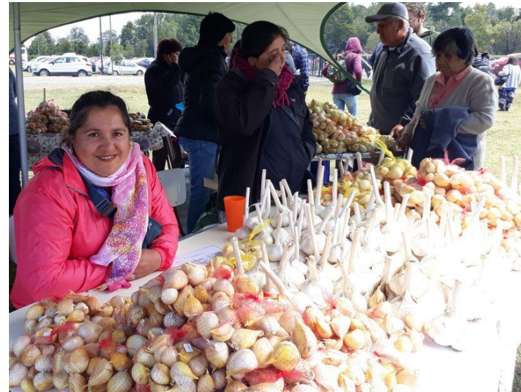
Figura N° 22 Fiesta del ajo.

Esta hermosa fiesta, es organizada por la Ilustre Municipalidad de Dalcahue, congregando a miles de visitantes, rescatando tradiciones y entregando al público un momento grato de esparcimiento y entretenimiento, donde, además, se premia al agricultor con la cabeza de ajo más grande ( https://bit.ly/39cFKCX ).