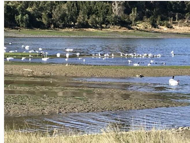
Figura N° 10 Humedal Teguel

Cada año arriban gran cantidad de aves migratorias en las que destaca el zarapito (Servicio Nacional de Turismo, 2012).