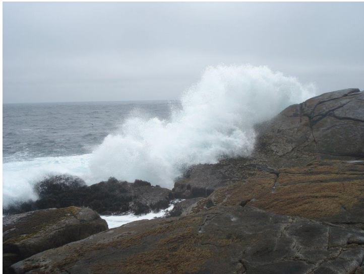
Figura N° 10 Piedra El Trueno.

Se destacan también la gran cantidad de especies que se encuentran en el ecosistema intermarial que bordea la piedra (Municipalidad de El Quisco).