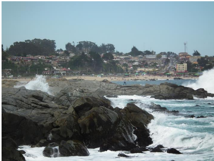
Figura N° 3 El Quisco .

Su nombre viene de la cactácea Quisco ( Echinopsis chiloensis ), proveniente de la palabra Quechua “khishka. La comuna de El Quisco se constituye como tal el 30 de agosto de 1956 bajo la presidencia de Carlos Ibáñez del Campo bajo Decreto Ley N° 12.110. Después de ser creada la comuna, muchas familias migraron haciendo de este lugar, su espacio preferido de veraneo (SERNATUR, 2012).