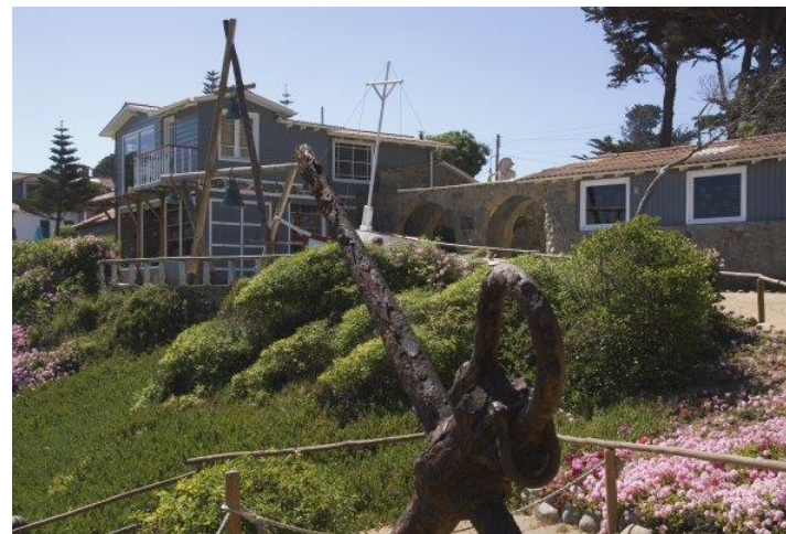
Figura N° 6 Casa Museo de Pablo Neruda.

Declarada Monumento Histórico D.S. 569 del 08/06/1990. Por la potencia evocadora de los objetos que guarda y por su entorno dominado por la presencia del mar, la casa de Isla Negra es una especie de compendio visual y material del imaginario poético de Neruda. El lugar se llamaba originalmente Las Gaviotas. El poeta lo rebautizó como Isla Negra por el color de sus roqueríos y quizás porque ahí podía aislarse para escribir. (SERNATUR, 2012).