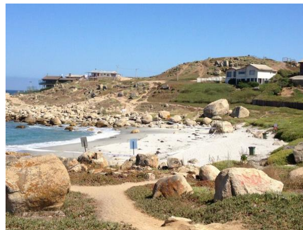
Figura N° 8 Playa Las Conchitas.

Ubicada en el centro de la comuna. Habilitada desde el año 2017 como la única Playa Inclusiva de El Quisco, fue adaptada para personas con capacidades diferentes o adultos mayores con movilidad reducida. Cuenta con dos sillas de ruedas anfibas, especiales para trasladar por la arena e introducirla al mar. Junto a este equipamiento se encuentran una serie de profesionales que la ponen en funcionamiento todos los días de la semana durante enero y febrero (Municipalidad de El Quisco).