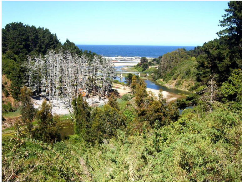
Figura N° 12 Santuario de la Naturaleza Quebrada de Córdova.