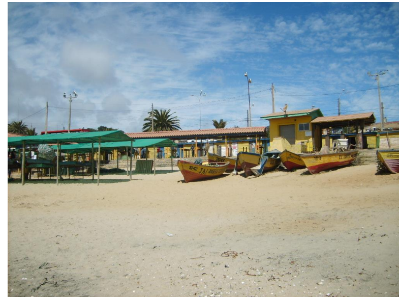
Figura N° 4 Caleta de pescadores de El Quisco .

Caleta de pescadores muy pintoresca, en ella se expenden los productos frescos del mar. Se puede acceder a paseos en lancha que permiten admirar la zona y conocer la flora y fauna marina, además de las actividades propias de los hombres de mar (SERNATUR, 2012).