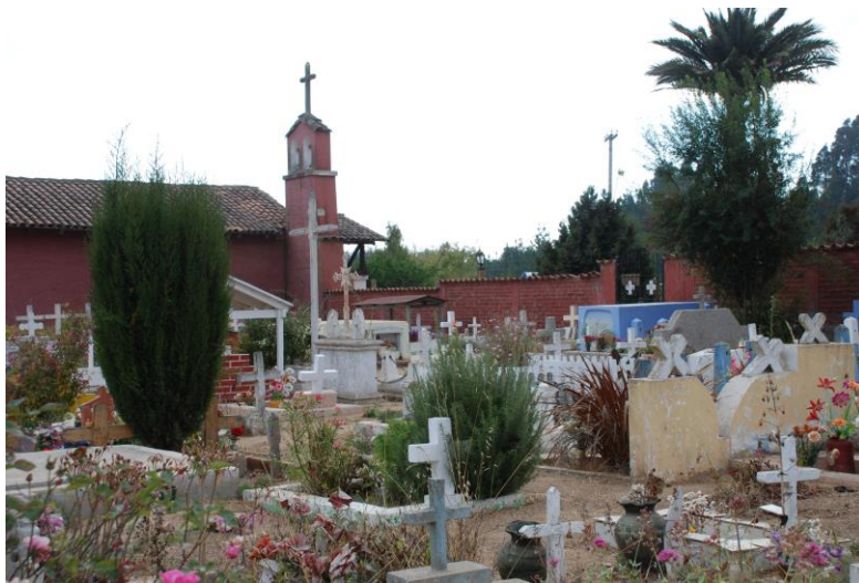
Figura N° 15 Cementerio Colonial.

Se encuentra a un costado de la Iglesia y está abierto todos los días de 09:00 a 18:00 horas. En este lugar descansan los restos de los primeros pobladores de la comuna, convirtiéndose en un atractivo que vale la pena visitar debido a las numerosas historias que recorren sus tumbas, además de ser el cementerio más antiguo de la provincia (Municipalidad de El Quisco).