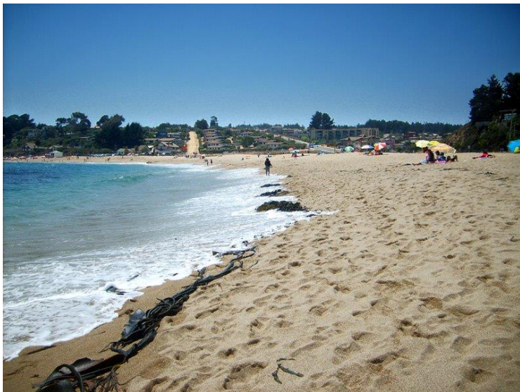
Figura N° 7 Playa Los Corsarios. Fuentes: http://bit.ly/2IU Mann

La playa “principal” llamada Los Corsarios, es la más popular y transitada de la comuna. Es apta para el baño, ya que cuenta con salvavidas durante toda la época estival. Convoca a surfistas y practicantes de todos los deportes náuticos (Municipalidad de El Quisco).