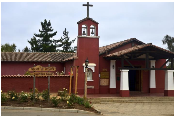
Figura N° 5 El Totoral.

Lugar típico en el que se funde lo español con lo chileno. Fue una encomienda de Alonso de Córdoba en 1570 y formó parte del camino desde San Antonio a Valparaíso. El atractivo histórico - religioso principal lo constituye la Iglesia del pueblo. Su ambiente es caracterizado por leyendas y tradiciones. Existen artesanos de telar y pequeños agricultores ofertando sus productos: flores, frutas, verduras, miel, muestras de gastronomía y repostería típica (SERNATUR, 2012).