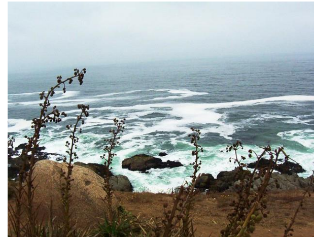
Figura N° 2 Punta de Tralca . Fuente: http://bit.ly/2ITwTD8

Balneario ubicado entre El Quisco e Isla Negra, caracterizado por sus enormes formaciones rocosas que se internan varios metros mar adentro. Posee una extensa playa de arenas blancas apta para el baño. Cercano se encuentra el cerro Cantalao, donde se pueden apreciar esculturas de piedra realizadas por artistas franceses en honor a Pablo Neruda y la misteriosa Cueva del Pirata (SERNATUR, 2012).