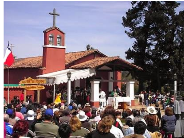
Figura N° 17 Fiesta Costumbrista.

En el marco de su historia colonial, la localidad de El Totoral celebra en febrero su tradicional fiesta costumbrista, la cual espera a los visitantes con preparaciones típicas del campo de la zona central, sus famosos licores, mermeladas y espectáculos artísticos – folclóricos (Identidad y Futuro).