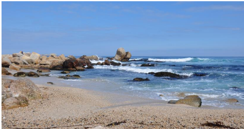
Figura N° 1 Isla Negra . Fuente: http://bit.ly/2kMsIZF

Declarada Zona Típica D.E. 187 del 15/12/1997. Su nombre actual fue dado por su más notable residente: el poeta Pablo Neruda. Isla Negra renace como centro cultural a fines de los ochenta, tanto por la creación de la Red Cultural Comunitaria de Isla Negra, como por la apertura al público de la Casa-Museo de Neruda (1991). Se caracteriza por un paisaje urbano donde los árboles y otras flores le otorgan una atmósfera especial (Servicio Nacional de Turismo, SERNATUR, 2012).