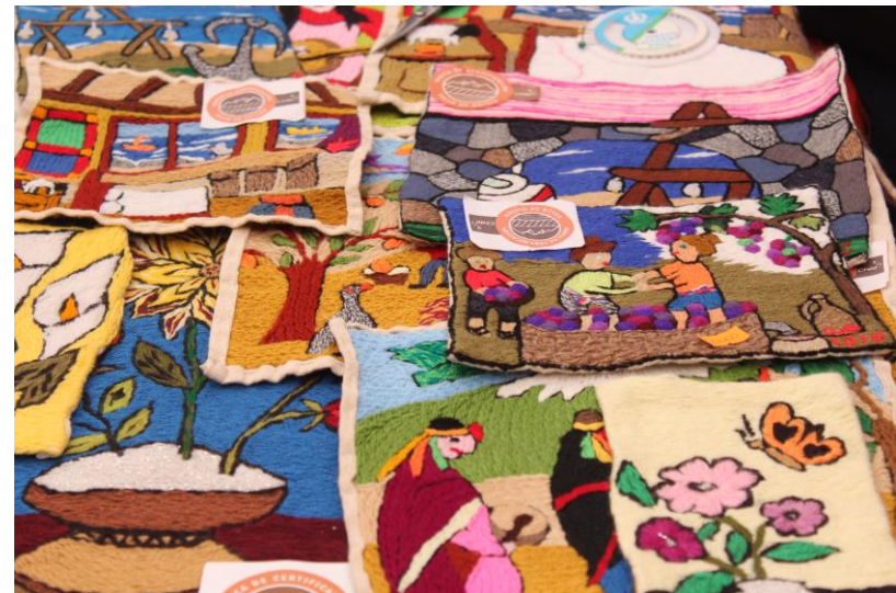
Figura N° 11 Bordadoras de isla Negra.

bordadoras comenzaron su trabajo en los años 60, siendo conocidas en el mundo por sus arpilleras Naif, con motivos rurales y marinos. El año 2016 fueron reconocidas con el Sello de Origen. Estas creaciones se comercializan en la casa museo de Isla Negra y en el paseo de las artesanías que se encuentran en la avenida principal (Municipalidad de El Quisco).