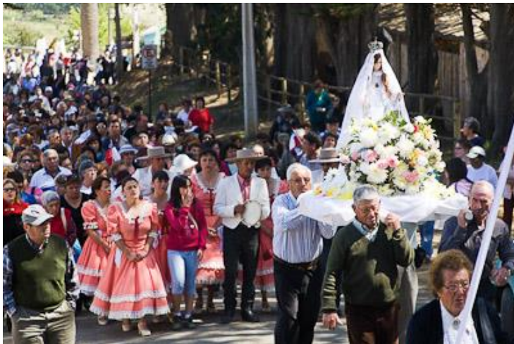
Figura N° 16 Fiesta Virgen de la Merced de El Totoral.

Se rinde honor a la Virgen de la Merced, realizando diversas misas, canticos y una vigilia en ofrenda a la Madre de Dios. Existe participación de toda la comunidad escolar, realizando una misa a la chilena con cuasimodistas. Una de las costumbres es que los creyentes suban al Cerro La Cruz donde rinden tributo a la Virgen. La iglesia data del año 1815 y la imagen de la Virgen fue dejada por Casimiro Marco del Pont (SERNATUR, 2012).