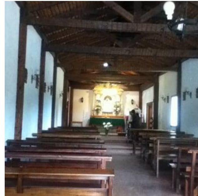
Figura N° 13 Iglesia Nuestra Señora de la Merced.

Ese día se rinde honor a la Virgen de la Merced en la localidad de El Total, donde se realizan diversas misas, procesiones y una vigilia en ofrenda a la Madre de Dios con canto a lo Divino. (Municipalidad de El Quisco).