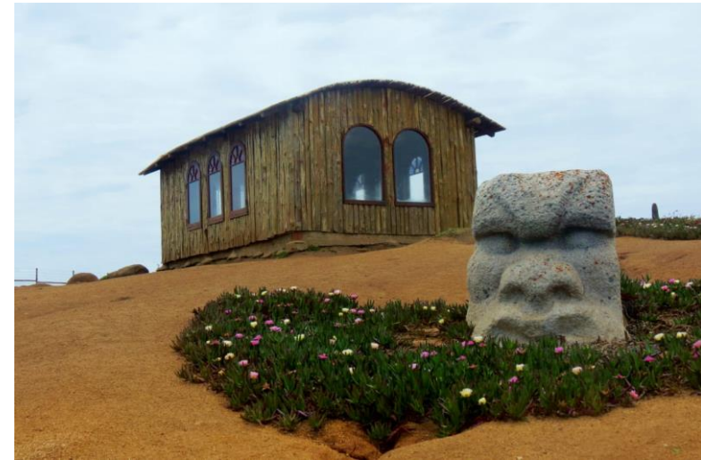
Figura N° 9 Mirador Cantalao .

Se puede tener una cautivadora vista en 360°, además de apreciar entre sus senderos los pequeños “bosques” de Chaguales ( Puya chilensis ), especie protegida, Challamillay y Huallilemu (Municipalidad de El Quisco).