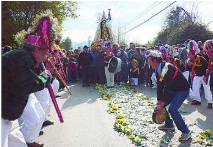
Figura N° 8 Fiesta de la Virgen del Carmen de Petorquita.

Cada 16 de julio, se celebra la fiesta de la Virgen del Carmen en la localidad de Petorquita. A esta fiesta religiosa, llegan cientos de fieles a peregrinar y adorar a la Virgen del Carmen ( https://bit.ly/2MHf8Cq ).