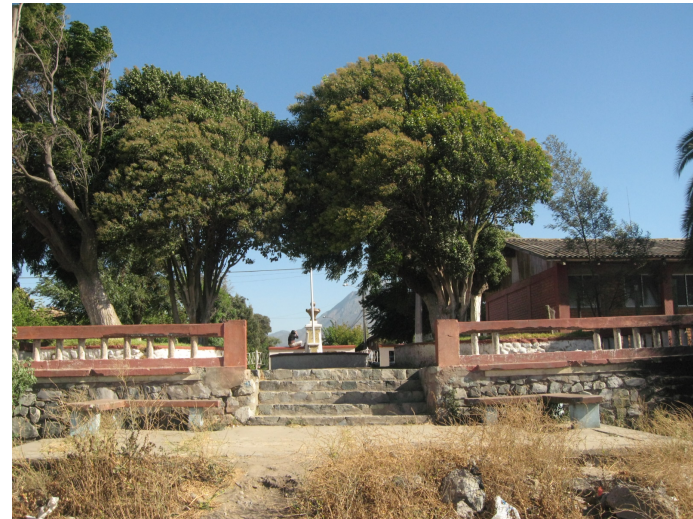
Figura N° 6 Ex Estación Villa Prat.

Es reconocida como una de las estaciones más hermosas y rústicas del otrora trayecto Santiago-Valparaíso. El lugar tenía una vista privilegiada hacia el río Aconcagua. En la actualidad, existe un paseo peatonal y un busto en honor a Arturo Prat, donde se realiza cada 21 de mayo el tradicional desfile de las Glorias Navales ( https://bit.ly/2MHf8Cq ).