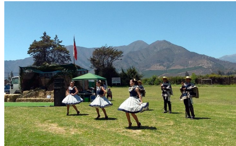
Figura N° 9 Feria Costumbrista.

En febrero de cada año, se lleva a cabo esta feria costumbrista organizada por la Cámara de Turismo de Hijuelas, la cual busca rescatar las tradiciones del campo chileno y mostrar el trabajo de los emprendedores locales ( https://bit.ly/2MHf8Cq ).