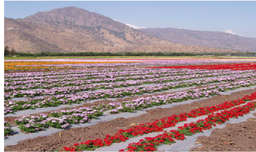
Figura N° 1 Hijuelas.

Es conocida como la “Capital de las Flores”, por ser la comuna con mayor porcentaje de producción de estas en el país. Prácticamente la mitad de las flores producidas en Chile, tienen su origen en Hijuelas. El 25 de mayo de 2009 todo su territorio fue declarado por la Unesco como Reserva Mundial de la Biósfera. El valle conocido actualmente como Hijuelas, era antiguamente llamado Las Hijuelas de Torrejón, debido al apellido del que fue su dueño, Manuel de Torrejón, corregidor de Quillota en el año 1718 (SERNATUR, 2012).