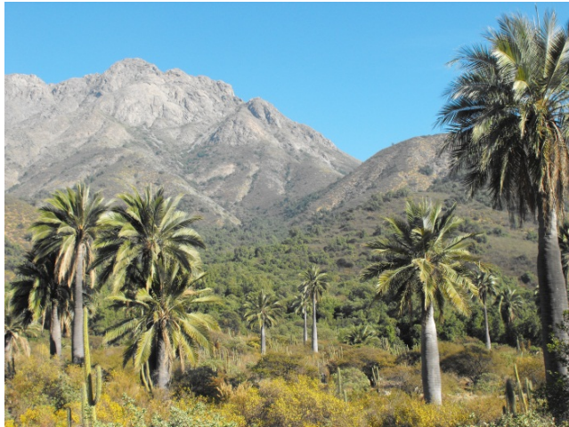
Figura N° 2 Ocoa .