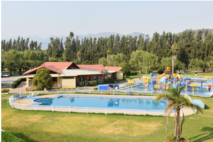
Figura N° 7 Centro Turístico Valle de Romeral.

Centro turístico que cuenta con 20.000 m 2 de áreas verdes, piscinas, toboganes, áreas deportivas, restaurante, zonas de picnic y camping ( https://bit.ly/2MHf8Cq ).