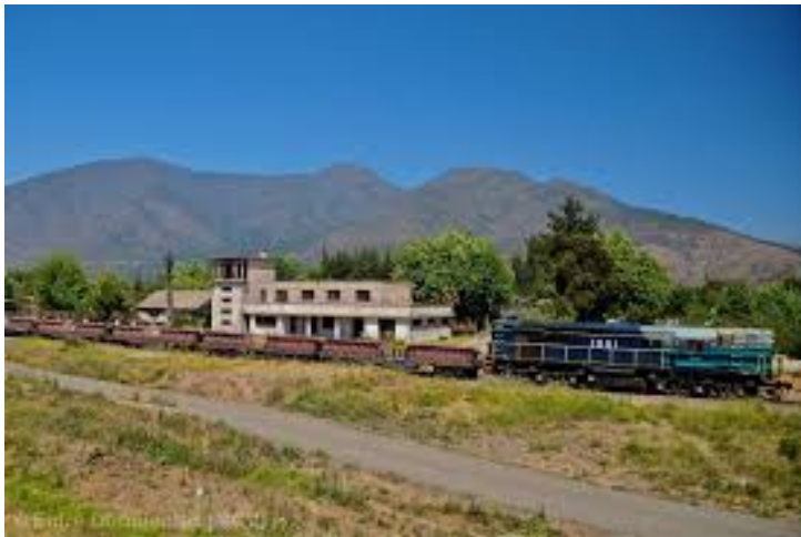
Figura N° 5 Ex Estación Hijuelas.

Antigua estación ferroviaria del tramo Santiago-Valparaíso, de mediados del siglo XIX. Aunque ya no existe transporte de pasajeros, por sus vías aún pasan trenes cargueros ( https://bit.ly/2MHf8Cq ).