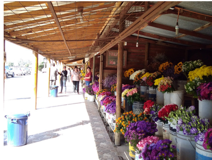
Figura N° 4 Puestos Florales.

Hijuelas es una comuna rural, cuya principal actividad económica la constituye la floricultura y la horticultura. Famosa por los puestos al lado de la carretera donde se venden sus productos. Hijuelas se ha ganado el nombre de "La Capital de las Flores" (SERNATUR, 2012).